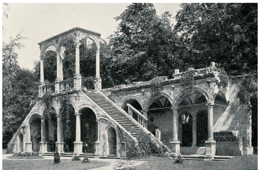
Ruine des Neuen Lusthauses im Stuttgarter Schlossgarten, Fotografie um 1906

Nach dem verhängnisvollen Theaterbrand bewegte die „Lusthausfrage“ die Gemüter der Stuttgarter. Sollte man das Neue Lusthaus rekonstruieren und in vereinfachter Form wiedererstehen lassen? Oder sollte man wenigstens die vorhandenen Gebäudeteile retten? Frühzeitig meldete sich der Württembergische Geschichts- und Altertumsverein zu Wort. Im Februar 1903 verabschiedete die Mitgliederversammlung eine einstimmig angenommene Resolution, „die noch vorhandenen Reste des Lusthauses zu erhalten.“ Im Unterschied zu staatlichen Behörden, die den Hof der Technischen Hochschule für den Wiederaufbau der Gebäudeteile ausersehen hatten, machte sich der Verein für deren Aufstellung in den Königlichen Anlagen stark. Tatsächlich gelang es, die künstlerisch