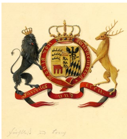
Entwurf des württembergischen Staatswappens, 1817

Der enorme Gebietszuwachs, den Württemberg unter König Friedrich († 1816) erzielt hatte, spiegelte sich in dem um mehrere Felder erweiterten Wappen. Im Unterschied zu seinem Vater setzte jedoch der Thronfolger Wilhelm I. (1816-1864) auf Reformen, auf