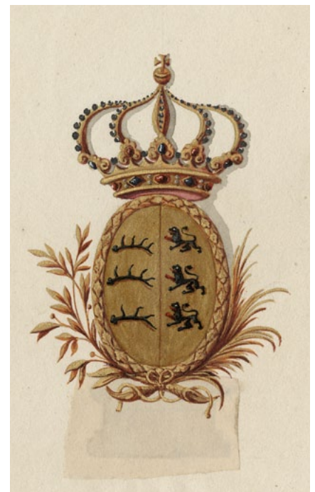
Entwurf des württembergischen Staatswappens, 1817