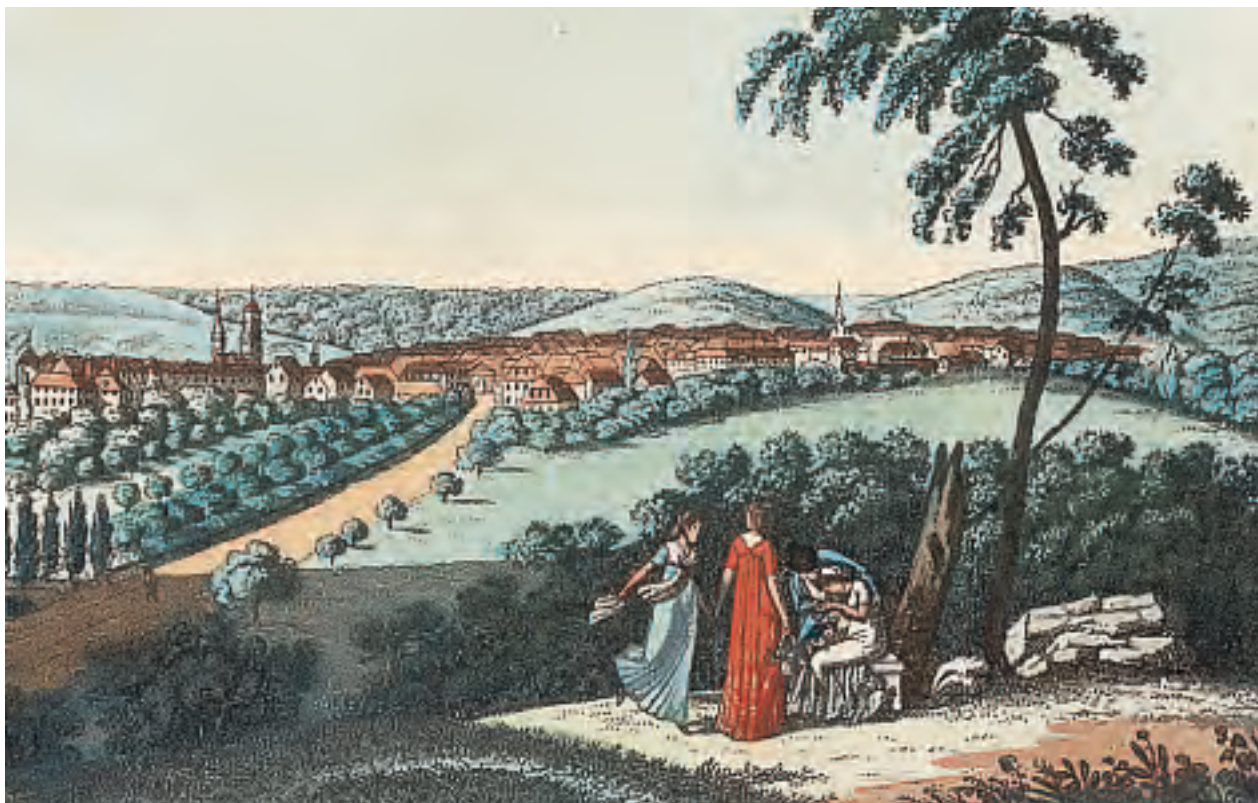
Stuttgarts höhere Töchter trugen Empire: locker fallende Hemdkleider, nackte Arme. Kein Reifrock, kein Korsett engte ihre Bewegungsfreiheit ein. Radierung (Ausschnitt), koloriert, um 1810, Künstler unbekannt, sc. (gestochen von) «Müller».