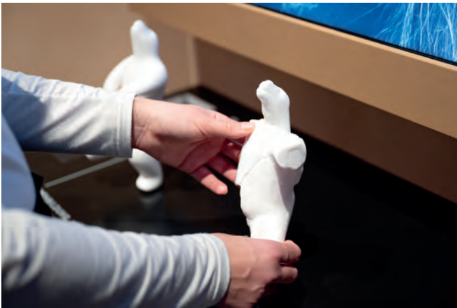
Taststation mit vergrößerter Kopie der Bärenfigur aus dem Geißenklösterle