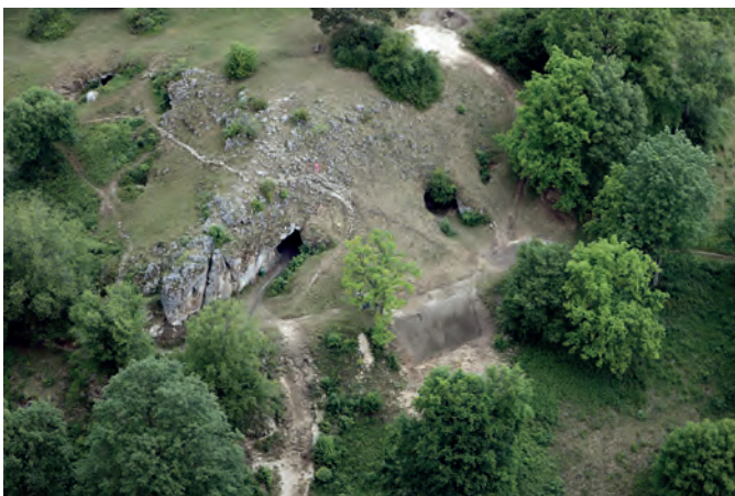
Die Vogelherdhöhle bei Niederstotzingen im Lonetal auf einem Luftbild

Zusammengenommen ergibt sich damit am Beginn der jüngeren Altsteinzeit ein eher heterogenes Bild an dargestellten Motiven, das mindestens in den Figuren der Löwenmenschen auch weit über das rein Beobachtbare hinausgeht und auf eine symbolische Ebene verweist. Dies trifft ebenso auf die typischen Verzierungen in Form von abstrakten Ritzungen oder Kerben zu, die gezielt auf den Figuren angebracht wurden. Zudem stammen aus denselben Ausgrabungsschichten die ältesten Musikinstrumente überhaupt. Es handelt sich um mehrere Flöten, die zum Teil ebenfalls aus Mammutelfenbein in sehr aufwendiger Art und Weise hergestellt wurden. Eine wichtige Rolle haben also offenbar nicht nur die Instrumente und Figuren selbst gespielt, sondern auch das dafür verwendete Rohmaterial. Denn die intensive Verarbeitung von