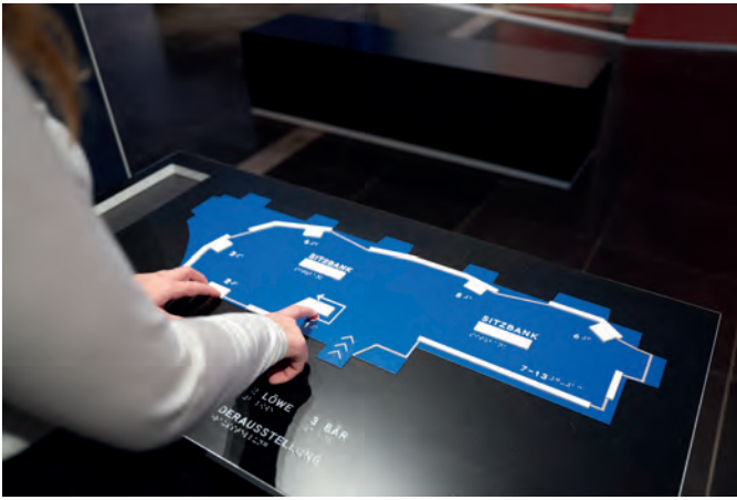
Erststbarer Übersichtplan der Ausstellung