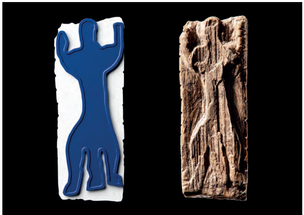
Der sogenannte Adorant als Tastobjekt und im Original