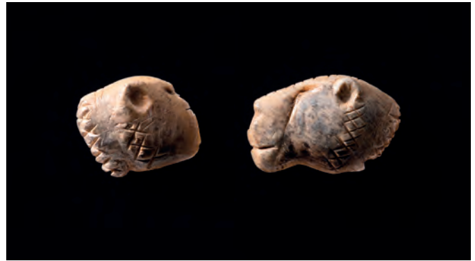
Die beiden Hälften des Löwenköpfchens aus der Vogelherdhöhle

Aber was ist das Besondere an dem nur sehr fragmentarisch erhaltenen kleinen Bären aus dem Geißenklösterle