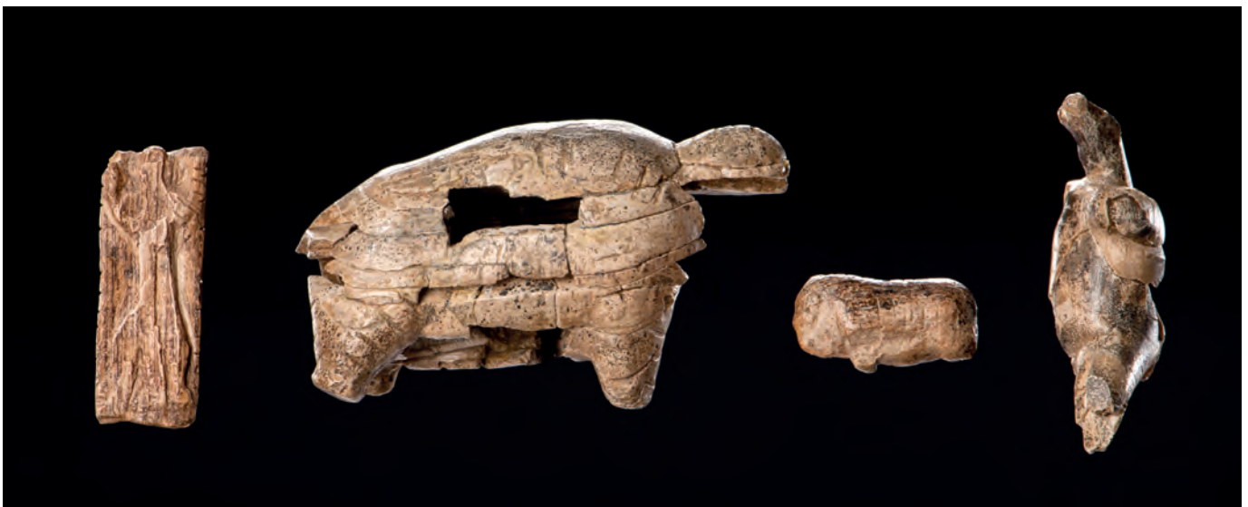
Vier Elfenbeinkunstwerke aus dem Geißenklösterle: Adorant, Mammut, Bison und Bär

Die Eiszeitkunst auf der Schwäbischen Alb ist direkt mit der Ausbreitung des anatomisch modernen Menschen von Afrika nach Europa verbunden. Denn aus den ältesten, ca. 43.000 Jahre alten Schichten des Homo sapiens aus dem Geißenklösterle stammen auch einige der Kleinplastiken aus Mammutfelßen. An ein solch frühes