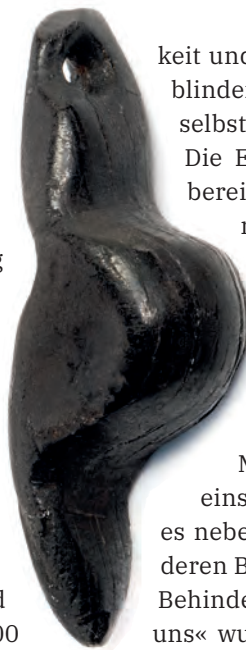
Oben: Frauenfigur aus Gagat aus dem Petersfels bei Engen

Um die außergewöhnliche Bedeutung der kleinen und auf den ersten Blick für Laien eher unscheinbaren Kunstwerke als Zeugnisse des ältesten Kunstschaffens der Menschheit auch für Besucher*innen mit Seh-einschränkungen erfahrbar zu machen, brauchte es neben dem fachlichen Input auch die Expertise zu deren Bedarfen und Wünschen. Nach dem Leitsatz der Behindertenrechtsbewegung »Nichts ohne uns über uns« wurden deshalb von Beginn an Expert*innen in eigener Sache einbezogen. Fünf Teilnehmer*innen mit unterschiedlichen Sehbeeinträchtigungen – von stark sehbeeinträchtigt bis blind und geburtsblind – konnten für eine Fokusgruppe gewonnen werden. In mehreren halbtägigen Workshops sowie in Einzelgesprächen begleiteten sie das Projekt über viele Monate und nahmen intensiven Einfluss auf die Gestaltung der Ausstellung. Nach der Vorstellung erster Ideen, der Räumlichkeiten und vor allem der Objekte bei einem Rundgang in der Schausammlung und mithilfe von Abgüssen und Repliken durch das kuratorische Team beim Auftaktworkshop ging es in den weiteren Terminen um die konkrete Ausgestaltung der Ausstellung: Vom Aufbau der Stationen, Größe und Design der Tastobjekte über die taktile Beschriftung, Audiodeskriptionen und App bis hin zu Orientierung und