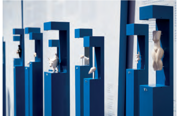
Nachgeschnitzte Figuren der Wanderausstellung, die insgesamt 23 Kunstwerke aus der jüngeren Altsteinzeit Europas vorstellt.

Auf 120 m 2 finden so in einem kurzweiligen Rundgang 30.000 Jahre altsteinzeitliche Kunstgeschichte Platz, die hoffentlich viele Menschen unabhängig von ihren Vorkenntnissen oder Voraussetzungen in ihren Bann ziehen kann.