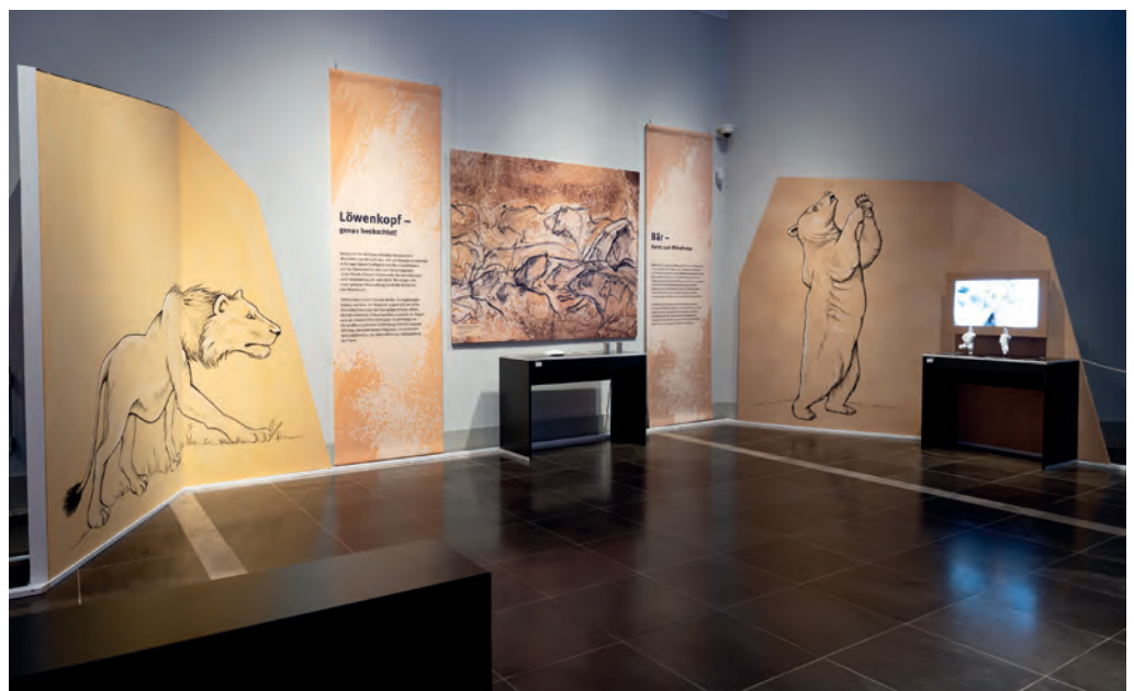
Blick in die Ausstellung mit den Stationen zum Löwenköpfchen und zum Höhlenbären

Die dritte Station thematisiert die abstrakten Frauenfiguren der ausgehenden Altsteinzeit. Die Darstellungen sind aufgrund des hohen Abstraktionsgrades nicht immer einfach zu verstehen. Dies gilt etwa für die Einritzungen auf einer Rentierrippe aus dem Petersfels, denn nur im Vergleich mit den dreidimensionalen Figuren aus Gagat oder Mammutelfenbein ist verständlich, dass es sich tatsächlich um Frauen in leicht gebückter Haltung handelt.