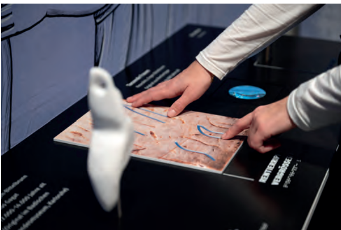
Blick auf die Station mit Frauendarstellungen aus der Petersfels-Höhle