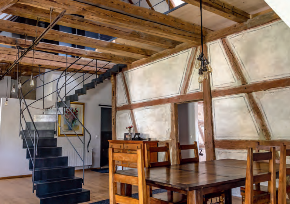
Die Wohnung der Bauherrenfamilie im geräumigen Speicher mit den alten Sommerkammern. Trotz neuer Nutzung blieb der offene Raumeindruck erhalten.

baut. Dem kleineren, westlichen Hausteil wurde 1866 für die landwirtschaftliche Nutzung ein Anbau angefügt, im hangseitigen Erdgeschoss zudem ein Stall eingerichtet. Außer kleineren erneuernden Maßnahmen wie dem Austausch von einzelnen Fenstern und Klapppläden sowie Reparaturen von Schäden durch aufsteigende Feuchtigkeit erlitt