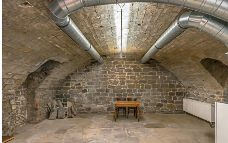
Wie das massive Erdgeschoss, so zeichnet sich auch der tonnen-gewölbte Keller durch sein qualitätvolles Mauerwerk aus.

Gewisse Zugeständnisse machten die Denkmalbehörden im Hinblick auf die Verbesserung der Lebensverhältnisse in den fünf Wohneinheiten des Hauses. Hier, insbesondere im Haus Jakobstraße 2, wurden teilweise Grundrissveränderungen gestat-