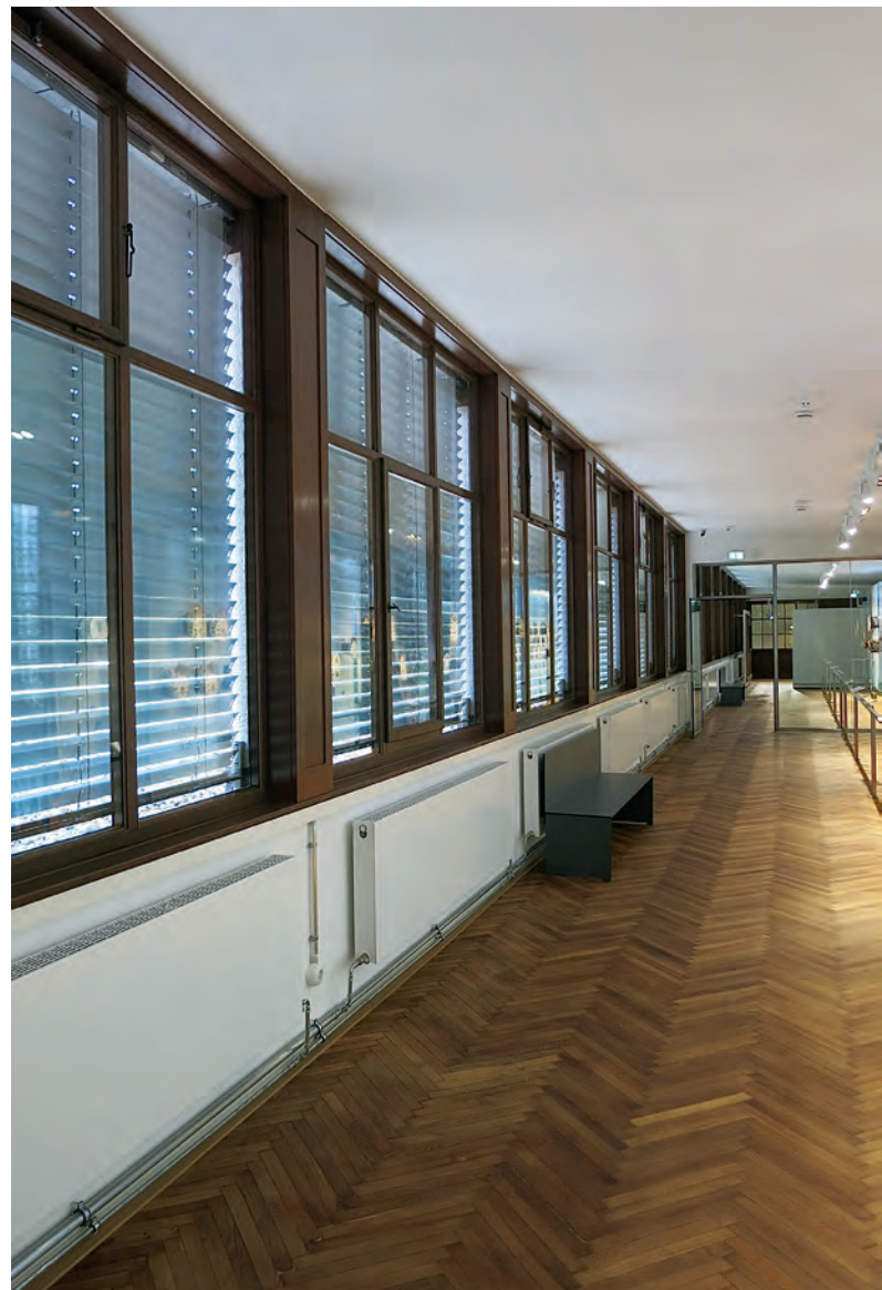
Die originalen Panzerfensterbänder mit fester doppelter Verglasung in den Arbeitsebenen wurden aufwändig saniert.

Weitere Informationen: www.schwaebischer-heimatbund.de/studienreisen und bei der Geschäftsstelle des Schwäbischen Heimatbundes (Tel. 0711 23942-11).