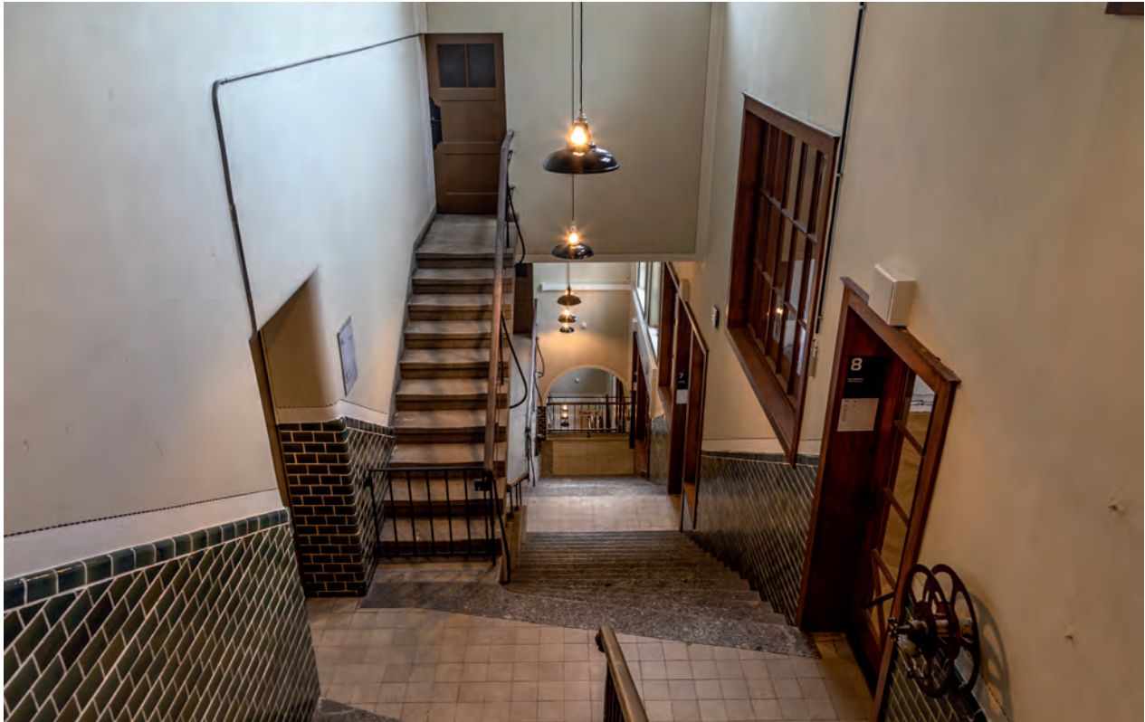
Fast zum schwindelig werden: Die seitlichen Treppenhäuser, die über 21 Meter Höhenunterschied alle neun Arbeitssäle der Terrassenebenen miteinander verbinden.

robusten Ausbaudetails wie Geländer, Fenster oder Türen vermitteln größte Solidität – «Wertarbeit» im sprichwörtlichen Sinn, wie sie etwa der 1907 gegründete Deutsche Werkbund auf seine Fahnen geschrieben hatte.