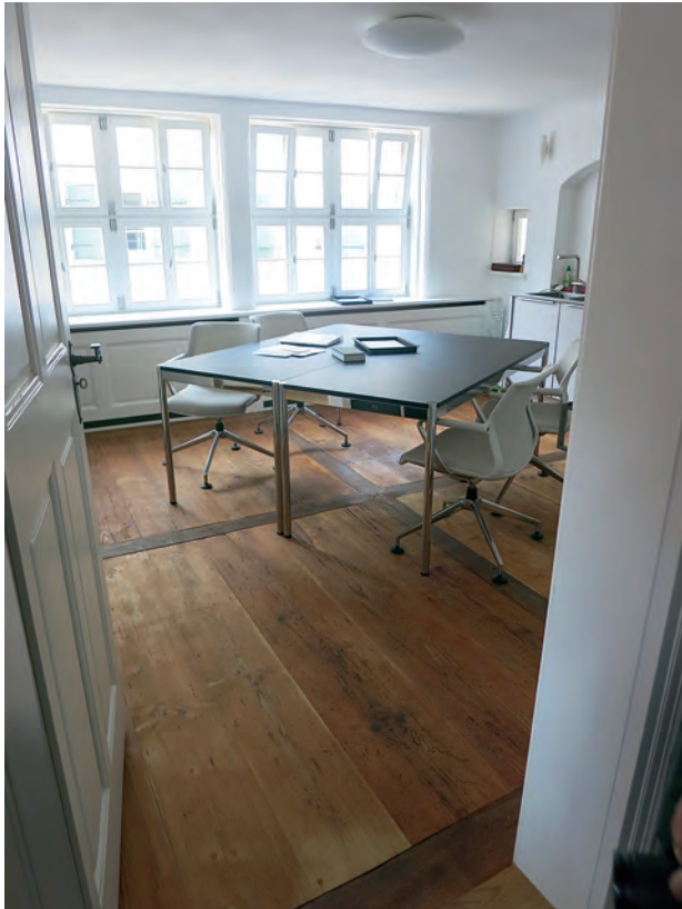
Ein repräsentatives Büro im ersten Obergeschoss. Der Dielenfußboden mit Friesteilung in Eiche wurde aufwändig restauriert.

der Vernachlässigung durch Fäulnis und Schädlingsbefall geschädigt war. Deutlich wurde auch, wie viele Ausstattungsdetails aus fünf Jahrhunderten sich am Gebäude erhalten haben: ein Brunnen im Keller, der Wellbaum eines Lastenaufzugs im Speicher, Reste von Renaissancestuck, Holztaferdecken, hochwertige Dielen- und Fliesenböden, ein barockzeitlicher Treppenlauf sowie vielfältige Befunde von spätmittelalterlichen und frühneuzeitlichen Farbresten und Ornamentmalereien bis hin zur klassizistischen Haustür und Beschlägen des 19. Jahrhunderts. Sie alle dokumentieren wie in einem Bilderbuch Kontinuität und Wandel einer handwerklich geprägten Wohnkultur im reichsstädtischen Ulm.