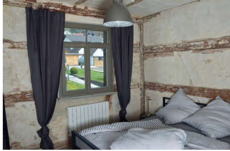
Schlafzimmer in der westlichen Ferienwohnung im ersten Obergeschoss. Die bauzeitlichen Putze und Fassungen der Wände sind großflächig erhalten und wurden restauratorisch gesichert.

Für die Eigentümer wurde im riesigen, mehrgeschossigen Dachraum eine dauerhaft zu nutzende, separate und großflächige Wohnung eingerichtet. Eine gestalterisch sich unterordnende einläufige Außentreppe führt nicht einsehbar von der Straße auf der bergseitigen Rückfront des Scheunenanbaus des 19. Jahrhunderts hinauf in deren Dachbereich. Im Innern geht es über filigrane Metalltreppen weiter hinauf auf die oberen Niveaus im Dachraum. Die originalen Stubeneinbauten mit ihren Fachwerk-wänden mit gut erhaltenen Oberflächen blieben ebenfalls erhalten, wie überhaupt im ganzen Haus restauratorisch freigelegte Putze und Farbfassungen viel zur ursprünglichen Atmosphäre beitragen. Durch planerische Sorgfalt wurde erreicht, dass die geringe Auf- und Zwischensparrendämmung am weithin sichtbaren Dach kaum auffallen. Die Wiederverwendung der historischen Biberschwänze der Dachdeckung, die in nur geringem Maße durch Zukauf von altem Material ergänzt werden musste, tut das Ihre, das gewachsene Gesamtbild zu wahren. Die für Wohnzwecke notwendige Belichtung des Speichers wurde mit Augenmaß realisiert. Sechs neue Gauben, wenig größer als ihre Vorgän-