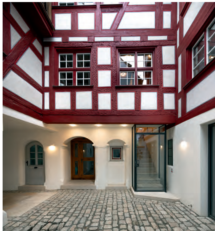
Der enge Innenhof mit seinem oxyd-roten Fachwerk dient als freundliches Entree für Läden und Wohnungen. Neues fügt sich unaufdringlich ein.

Als Fachmann für historische Bauten war es für den Architekten selbstverständlich, dass am Anfang der Planung eine anspruchsvolle wissenschaftliche Forschung am Gebäude und in den Archiven stehen musste, inklusive einer restauratorischen Untersuchung der Putze und Farbbefunde. Die Dokumen-