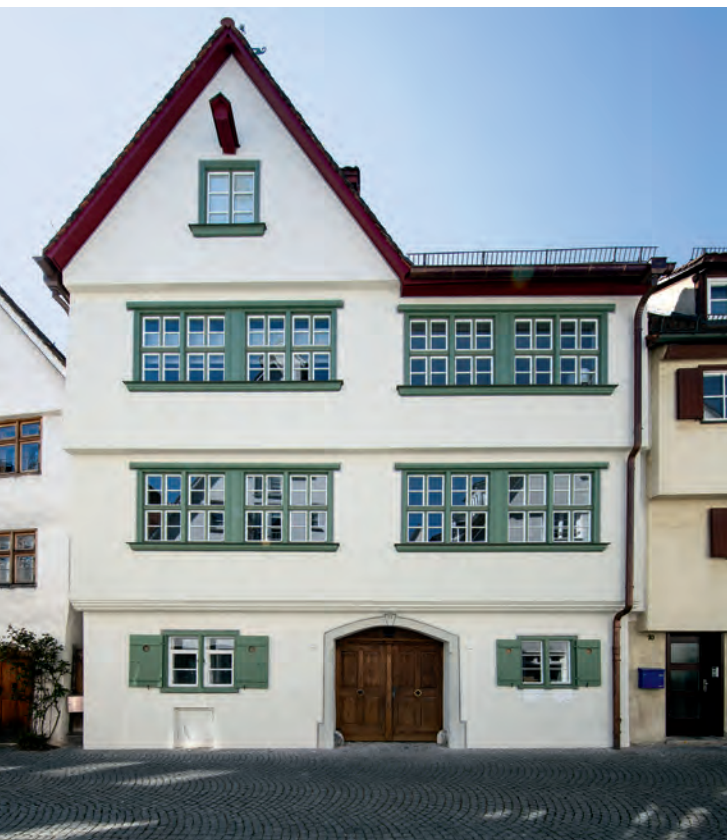
Nach Sanierung und Rekonstruktion der Bandfenster aus dem 18. Jahrhundert ist das Haus wieder ein Schmuckstück der Ulmer Altstadt.

nung mit Urkunden für die Eigentümer sowie die beteiligten Architekten und Restauratoren verbunden. Die Preise wurden im Rahmen einer Festveranstaltung im April 2019 im Stadthaus Ulm überreicht. Aus redaktionellen Gründen war die Vorstellung der Preisträger erst in diesem Heft der Schwäbischen Heimat möglich. Sie erscheint damit parallel zur Ausschreibung der nächsten Preisrunde 2020. Bis zum 31. März kann man sich dafür bewerben. Informationen bietet dazu ein Faltblatt, das bei der Geschäftsstelle des Schwäbischen Heimatbundes erhältlich ist, auch unter: