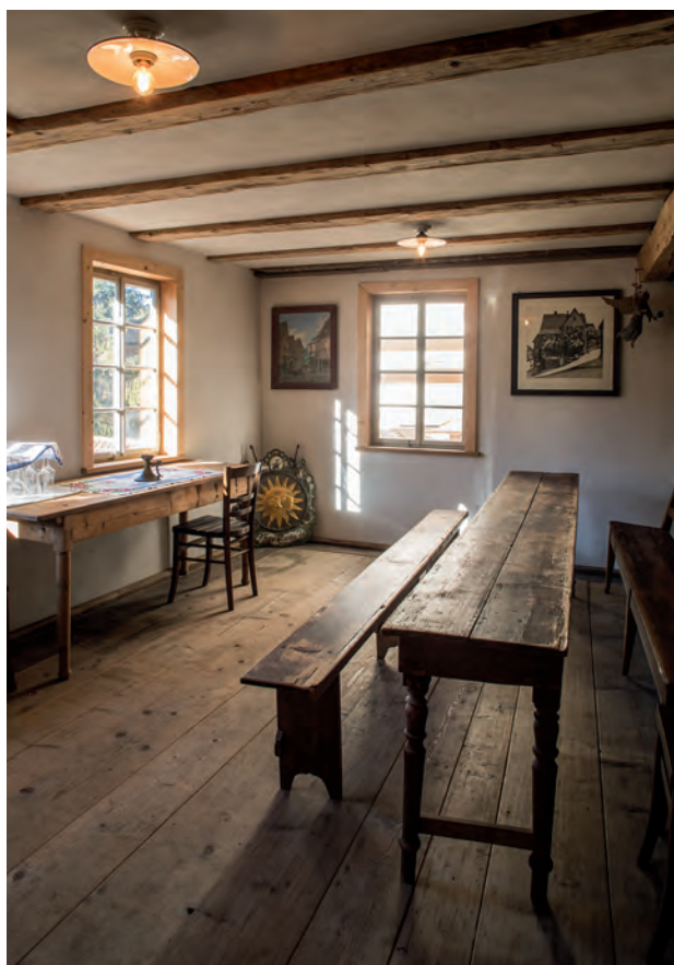
In der alten Wohnung im Obergeschoss: alter Boden, freigelegte Wände und Decken, wiederhergestellte Fenster und ein passender Fußboden aus alten Dielen.

Noch bis 2011 war die Backstube von der Stadt an eine Pächterfamilie vermietet, welche die beiden mehrfach reparierten Backöfen über Jahrzehnte genutzt hatte. Die Bäckerfamilie bewohnte das Obergeschoss, das in den 1950er-Jahren im Inneren für deren Zwecke modernisiert worden war, wobei die neuen Gipswände, Linolfußböden, sprossenlosen Fenster, Furniertüren und Sanitärereinbauten keine Rücksicht auf den Charakter des Gebäudes nahmen. Nachdem die bisherigen Mieter ausgezogen waren und sich kein neuer Pächter für das abgewohnte,