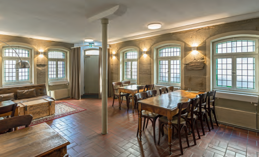
Die frühere Wirtschaft «Zum Schatten», von den Einbauten der Animierbar befreit, nun ein Treffpunkt für soziale Zwecke. Wieder geöffnet und restauriert: die Fenster mit ihren Bleiverglasungen.

Wandflächen zwischen den Öffnungen nur sehr schmal sind. Umlaufende Gesimse in profiliertem Holz an den Vorsprüngen der darunterliegenden Fachwerkkonstruktion unterstützen den Eindruck einer horizontalen