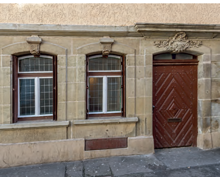
Die Erdgeschossfassade mit der original erhaltenen und sorgfältig restaurierten Haustüre, einem besonderen baulichen Detail einer verschwundenen bürgerlichen Kultur des 18. Jahrhunderts in Stuttgart.

Die öffentlichen Diskussionen um den bedenklichen Zustand der Häuser und ihre problematische