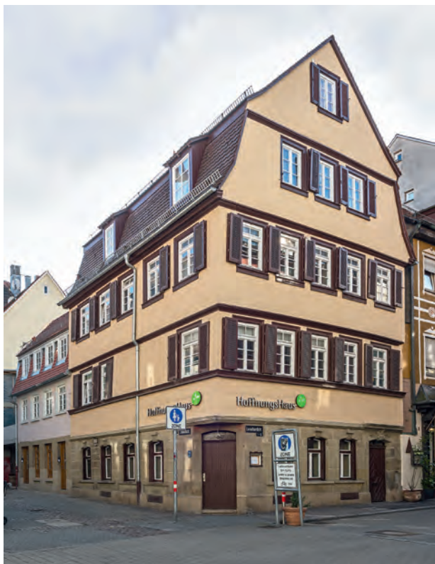
Eine Gebäudegruppe mit besonderer Geschichte und eine Rarität im Stuttgarter Stadtzentrum. Gesamtansicht der Gebäude Ecke Leonhard- und Jakobstraße. Links im Hintergrund das heute zugehörige kleinere Handwerkerhaus.

Dabei ist das Doppelanwesen nach einem Jahrhundert von stürmischer Großstadtverdichtung,