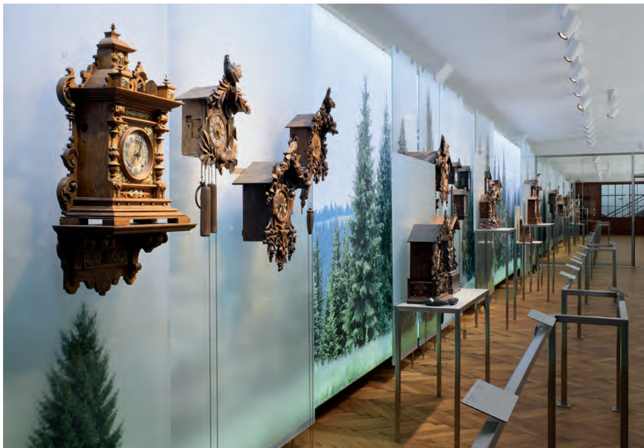
Die Ausstellungswände des neuen Uhrenmuseums sind von den bergseitigen Terrassenwänden abgesetzt, um eine Hinterlüftung zu gewährleisten.

Bauanalyse mit der Erstellung eines Raumbuchs stand. Fragen nach der Art der Konstruktion, etwa im Hinblick auf die Isolierung der Flächen gegen den Berg oder nach dem Zustand der originalen «Panzerfenster» mit fester Doppelverglasung, nach eventuellen Schadstoffen, vor allem dem Teer, mit dem das historische Stabparkett der Arbeitssäle auf den Betonboden geklebt worden ist, wurden vorab geklärt und konnten in die endgültige Planung einfließen.