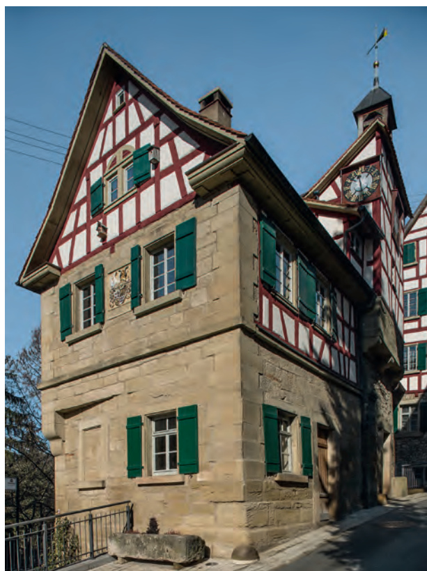
Das zweigeschossige Backhaus und der anschließende Uhrturm – eine malerische Baugruppe am Stadteingang von Forchtenberg.