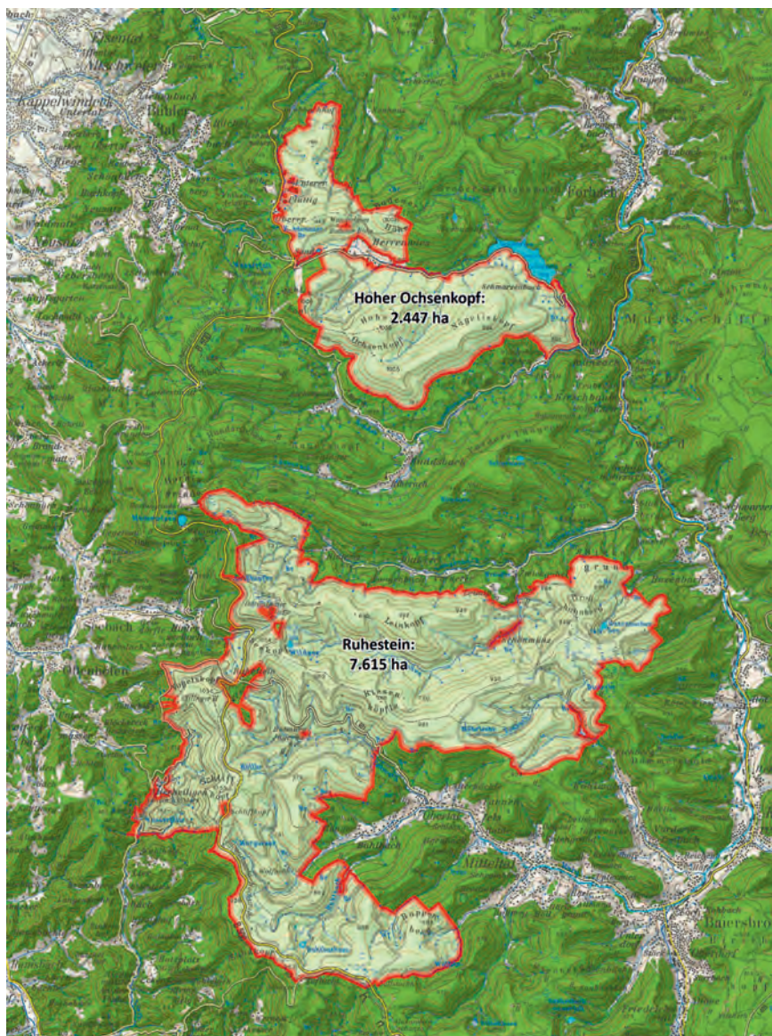
Der nur etwa 10.000 Hektar große, leider zweigeteilte Nationalpark Schwarzwald.

aus dem Nationalpark Bayerischer Wald (wo das Rotwild allerdings den Winter über in Gattern verbringt, in denen es auch reguliert bzw. reduziert wird) Berichte, wonach der Verbissdruck selbst auf die heikle Tanne spürbar nachgelassen habe, seit dort Luchs und Wolf wieder zugange sind. Neuerdings hält sich, sehr zum Schrecken der Bevölkerung, ja auch im Nordschwarzwald ein zugewandter Wolf auf, dem nicht nur etliche Schaf-, sondern auch Rotwildrisse zur Last gelegt werden. Anders sieht es mit dem Luchs aus, um dessen Wiedereinbürgerung sich seit über drei Jahrzehnten eine «Luchs-Initiative Baden-Württemberg e. V.» vergebens bemüht. Zwar gibt es im Nationalpark unweit der B 500 in der Nähe des Mehliskopf einen vielbesuchten «Luchs-Erlebnispfad», und aus der Schweiz schaffen auch immer wieder einmal einzelne männliche Luchse den Sprung über den Hochrhein herüber, ohne dass es hierzulande je zu Luchsnachwuchs