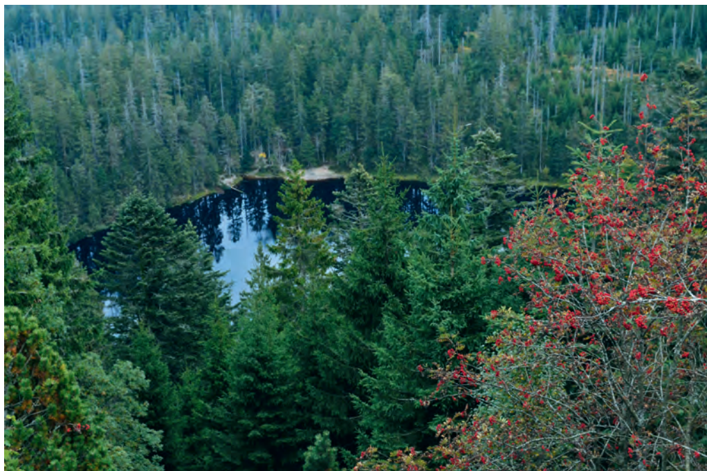
Einige Weißtannen in der Karwand über dem Wilden See haben den Großbrand im Dürrejahr 1800 überlebt, und nach dem Zusammenbruch der Käferfichten aus dem Jahr 1999 stellt sich der Wald heute wieder grüner dar.

Zwar besteht die Kernzone mit derzeit rund 3.000 Hektar noch überwiegend aus seit langem schon ausgewiesenen Naturschutz- und Waldschutzgebieten, darunter als Herzstück des Nationalparks der bereits 1911 auf Anregung des Tübinger Forstprofessors Christoph Wagner (1869–1936) gegründete Bannwald Wilder See, der älteste des Landes 2 . Doch sind sie auch sie noch von Forstwirtschaft geprägt – und damit stark fichtenlastig. Mag der Märchenerzähler Wilhelm Hauff (1802–1827) einst noch so von (Weiß-)Tannen geschwärmt und dem Schwarzwald so zu seinem Markenkern verholzen haben: Fichten dominieren im öffentlichen Wald von heute sowohl in den Kern- wie in den Entwicklungs- und Managementzonen. Denn die Weißtannen sind im 18. und 19. Jahrhundert zum Wohle der Staatskasse und der Holzhandelsgesellschaften nach Großkahlschlägen als Holländerstämme den Rhein hinunter verflößt worden. Und im Dürrejahr 1800 hatte um den Wilden See herum zudem noch ein Großbrand gewütet,