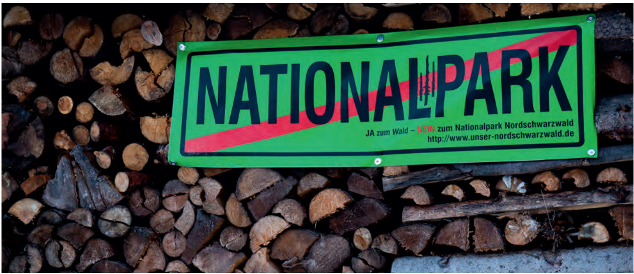
Plakate der Nationalparkgegner sind verschwunden. Geblieben ist die Angst vor dem Fichtenborkenkäfer.