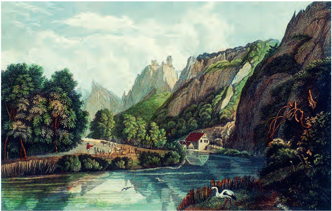
Ludwig Mayer (1791–1843): «Bronnen», 1836. Das Bild ziert den Frontispiz von Gustav Schwabs «Wanderungen durch Schwaben» von 1837. Die hier abgebildete Bronner Mühle wurde 1961 durch einen Erdrutsch zerstört. Stahlstich, gestochen von Franz Xaver Eissner, 9,7 x 15,3 cm.

Erhabene Natur, historische Denkwürdigkeiten: die Entdeckung als romantische Landschaft