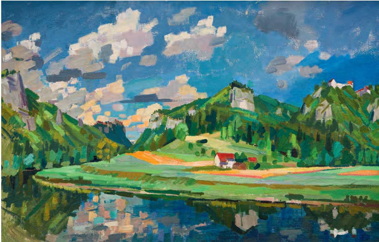
Hans Bucher (1929–2002): «Hochsommer im Donautal», 1976. Im ausgehenden 20. Jahrhundert hat Hans Bucher der längst totgesagten Landschaftsmalerei noch einmal kraftvolle Impulse verliehen. Öl auf Leinwand, 73 x 112 cm.