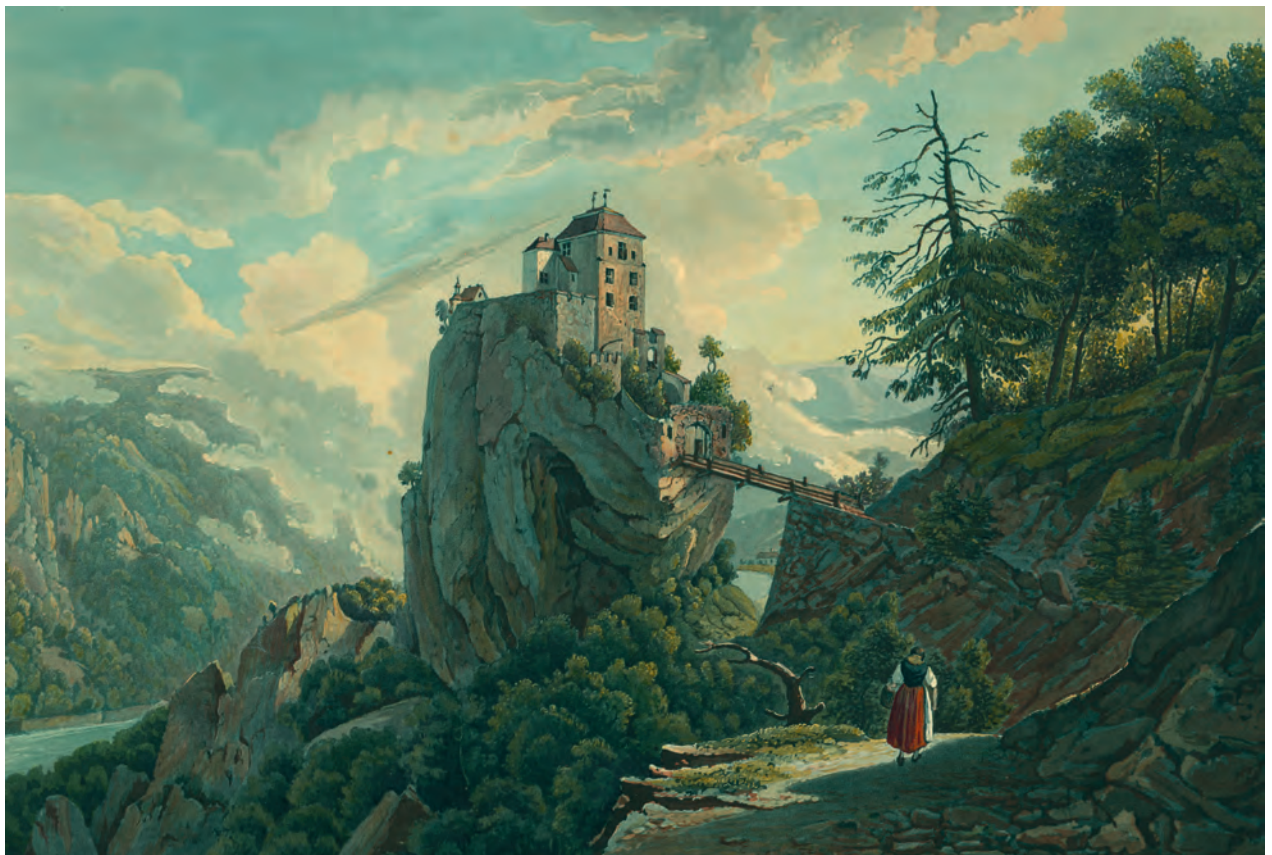
Johannes Ruff (1813–1886): «Schloss Bronnen im Donauthal», 1835. Eine der schönsten Donautal-Veduten im Geist der Romantik, erschienen 1835 in der Mappe «Malerische Reise der Donau» im Zürcher Locher-Verlag. Aquatinta-Radierung, koloriert, 17 x 24 cm.