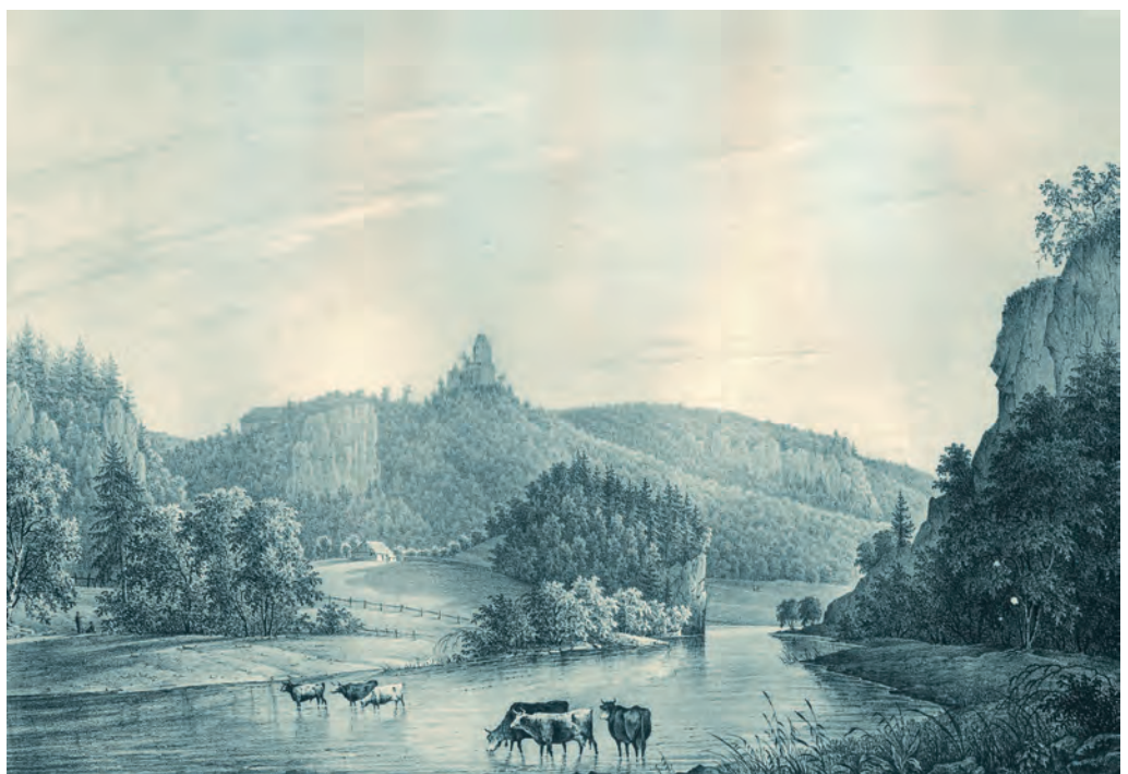
Maximilian von Ring (1799–1873): «Kallenberg», 1829. Eine der frühesten Darstellungen des oberen Donautals bedient romantische Erwartungen, indem sie eine ländliche Idylle mit schroffen Felsen und Burgruine präsentiert. Lithografie von Gottfried Engelmann, 20 x 29 cm.

Nicht minder entscheidend für das stetige Anwachsen des Fremdenverkehrs war neben dem Ausbau der Verkehrswege auch die Gründung des Benediktinerklosters in Beuron. In den Gebäuden des ehemaligen Augustiner-Chorherrenstifts war 1863 neues klösterliches Leben eingekehrt und die