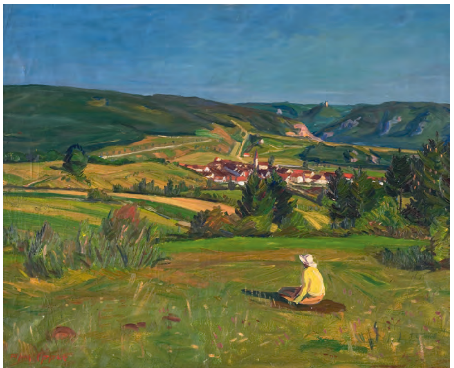
Alfons Epple (1899–1948): Donautallandschaft mit Fridingen, um 1937. Der hauptsächlich in München und im Chiemgau wirkende Maler setzte mit diesem Bild seiner Heimatstadt Fridingen ein Denkmal.

Mühe präzise zu lokalisieren wären. Nicht von ungefähr waren es selten Künstler mit akademischem Hintergrund, sondern eher Maler mit kunstgewerblicher Ausbildung, die sich – wie etwa die Tuttlinger Hans Dieter (1881–1968) oder Hugo Geißler (1895–1956) – vom Donautal wirklich noch verzaubern ließen und die Schönheit dieser Landschaft in ihre Bilder zu bannen versuchten. Einige wenige