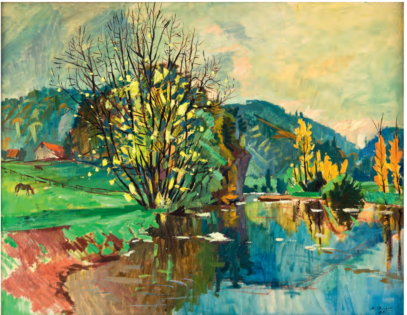
Hans Bucher (1929–2002): Scheuerlefen bei Fridingen , 1980. Bucher darf als der Donautalmaler schlechthin gelten. Ein ganzes Künstlerleben lang fand er hier seine Motive. In seiner Heimatstadt Fridingen ist ihm im «Scharf Eck» ein Museum gewidmet. Öl auf Leinwand, 87 x 108 cm.

Künstler immerhin – etwa Edmund Steppes (1873–1968), Hans Otto Schönleber (1889–1930), Paul Kälberer (1896–1974) oder Albert Birkle (1900–1986) – haben sich im Donautal aber auch zu durchaus originellen Bildfindungen im Sinne moderner Kunstströmungen anregen lassen und dabei Arbeiten geschaffen, die stilistisch in die Nähe des Expressionismus, der Neuen Sachlichkeit oder des Magischen Realismus gerückt werden können. In diesen seltenen Fällen hat die Donautallandschaft dann tatsächlich ein klein wenig befruchtend auf die Kunst der Moderne gewirkt. Im Übrigen aber ist selbstverständlich auch hier für den weiteren Verlauf des 20. Jahrhunderts das allgemeine Verschwinden der Landschaft aus der Kunst zu konstatieren. 10