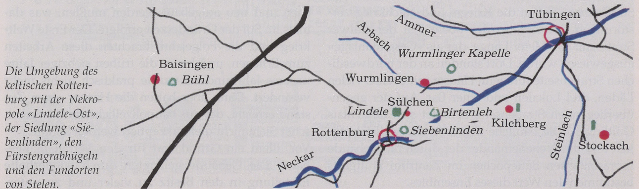
Die Umgebung des keltischen Rottenburg mit der Nekropole «Lindele-Ost», der Siedlung «Siebenlinden», den Fürstengrabhügeln und den Fundorten von Stelen.

Man bringt dies mit den Keltenzügen in Verbindung. Damals brachen viele Kelten nach Italien, auf den Balkan und bis in die Türkei auf, getrieben von Abenteuerlust, doch vor allem auf der Suche nach den sagenhaften Reichtümern, die einst ihre Fürsten von dort bezogen hatten. Wer zurückblieb, hat in kleinen Verhältnissen gelebt, sicher, herkömmlich und überschaubar. Neue kleine Siedlungen wurden angelegt, samt neuen Friedhöfen, die meist nur durch Zufall entdeckt werden, weil die Toten in Flachgräbern ohne auffällige Hügel beigesetzt wurden.