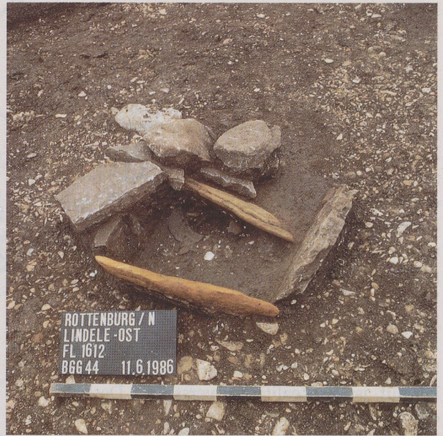
Oben rechts: Das Brandgrubengrab 44 war mit Steinplatten eingerahmt und mit einer Platte zugedeckt, die hier entfernt worden ist.

nisse der «Alb-Hegau-Keramik», Spitzenprodukte der Hallstatt-C-Zeit – damals mindestens so wertvoll wie heute echtes Meißner Porzellan. Reichtum und Rang der Dame unterstreichen auch zwei gegossene Armringe, zwei Gewandnadeln und zwei Ohrringe, die man ihr beigegeben hatte.