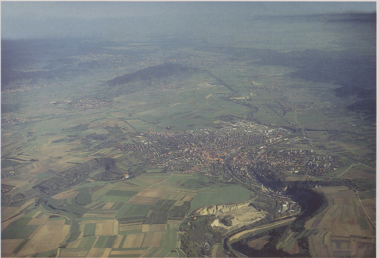
Das Luftbild, von Westen her aufgenommen, zeigt, wie sich der Neckar im Vordergrund durch den Muschelkalk zwingt und dann bei Rottenburg die breite Talaue der Tübinger Stufenrandbucht erreicht, die sich zwischen Rammert (rechts) und Spitzberg (links) erstreckt.

kults, Zeugnisse von Furcht und Eitelkeit, Allzumenschliches. Die neuen Erkenntnisse vermögen uns die Zeit und die Menschen von damals näherzubringen, helfen, sie besser zu verstehen. So paradox es klingen mag: Die Toten von Rottenburg beleben die Keltenzeit. In der Prähistorie ist man auf materielle Zeugnisse angewiesen, wenn man sich ein Bild machen will. Schriftliche Quellen fehlen dafür ganz. Die Kelten hatten keine Schrift. Dem Denken, der Religion, den Vorstellungen von Tod und Jenseits, wie sie die Entdeckungen des Friedhofs nahelegen, kommt man nur indirekt nahe, indem man aus Funden und Befunden vorsichtig Schlüsse zieht, das Wahrscheinliche erkennt, wohl wissend, daß es letztlich unbeweisbar bleibt.