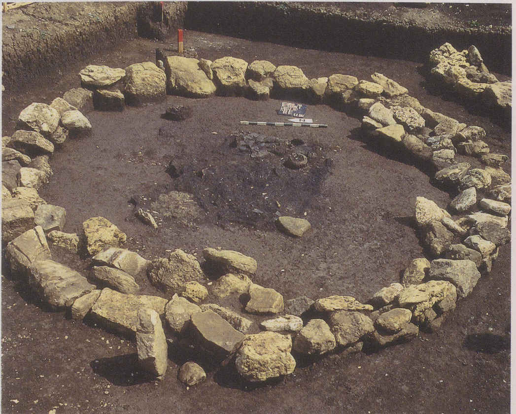
Von einem Steinkreis umgeben ist in «Lindele-Ost» die Grabkammer im Hügel 20. Die zentrale Brandbestattung ist mit Hallstatt-C-Keramik ausgestattet.

nach dem Platzbedarf für die Unterbringung der Grabbeigaben richtete. Ausgerichtet waren die Grabkammern nach Südosten beziehungsweise nach Nordwesten. Mit der Holzkohle vom Scheiterhaufen vermischt finden sich auch Keramikscherben von groben Gefäßen, die vermutlich bei einer Totenmahlähnlichen Zeremonie verwendet und dann rituell zerschlagen wurden. Die Grabkammer ist dann mit Balken, meistens aber mit Steinen abgedeckt worden. Darüber schütteten die Hinterbliebenen Erde zu einem Hügel auf, der in Rottenburg «Lindele» einen Durchmesser zwischen drei und achtzehn Metern besaß. Die Höhe des Grabhügels ist nur zu schätzen. Sie dürfte drei oder vier Meter betragen haben. Von den 71 Grabhügeln in der Nekropole waren 26 reine Erdhügel, die anderen 45 sind mit Steinkreisen umgeben gewesen. Vier Hügel waren nicht rund, sondern rechteckig, mit Seitenlängen von vier bis vierzehn Metern. Diese steingerahmten Hügel der Späthallstattzeit waren pyramidenförmig, wie die Grabmäler der ägyptischen Pharaonen – freilich viel kleiner und aus billigerem Material erbaut. Das verwendete Steinmaterial war übrigens uneinheitlich: Findlinge aus Dolomit und Kalkstein, Stubensandstein, Kiesel und Tuff. Die nächsten Vorkommen dieser Steinarten liegen drei Kilometer vom Gräberfeld entfernt. Um die Steine für den Grabbau heranzutransportieren, ist also einige