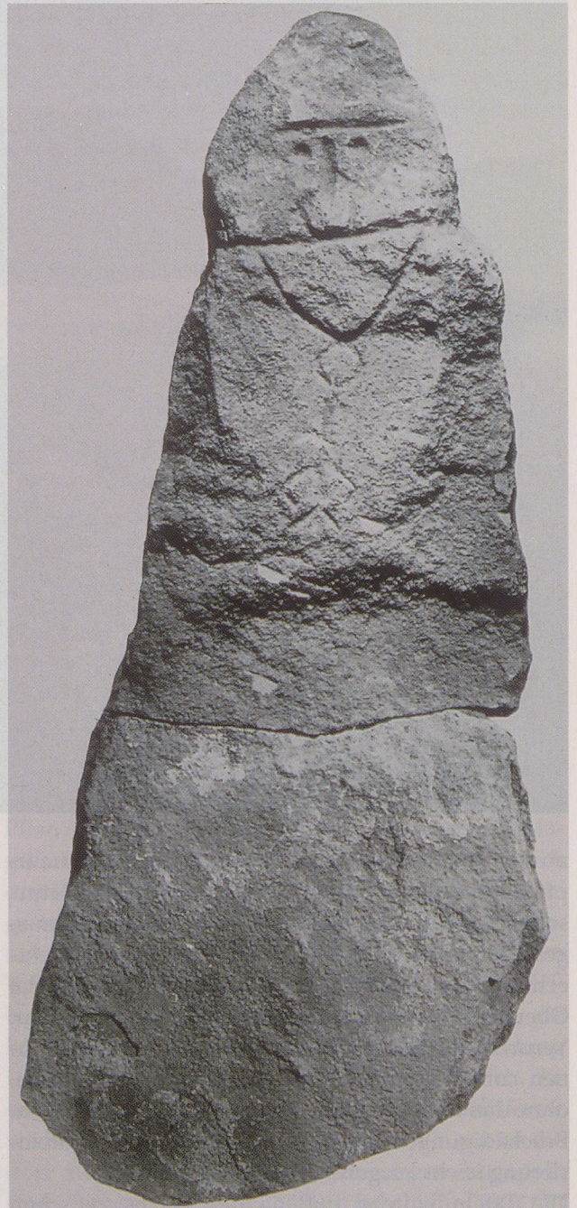
Grab-Stein aus Hügel 7, samt dem abgebrochenen Unterteil. Bisher hat man im Rottenburger Gräberfeld drei keltische Stelen in der Höhe 1,2 bis 1,4 Meter gefunden, stilisierte Menschengestalten.

Das keltische Gräberfeld liegt auf einer Niederterrasse des Neckars, am Fuße eines sanften Südwesthangs. Parallel zum Hang angelegt, ist es 125 Meter lang und 80 Meter breit. Da im Laufe der Jahrhunderte Wind und vor allem Wasser viel Lehm hangabwärts verlagerten, waren die Gräber bei ihrer Entdeckung meterhoch zugedeckt. Das hat ent-