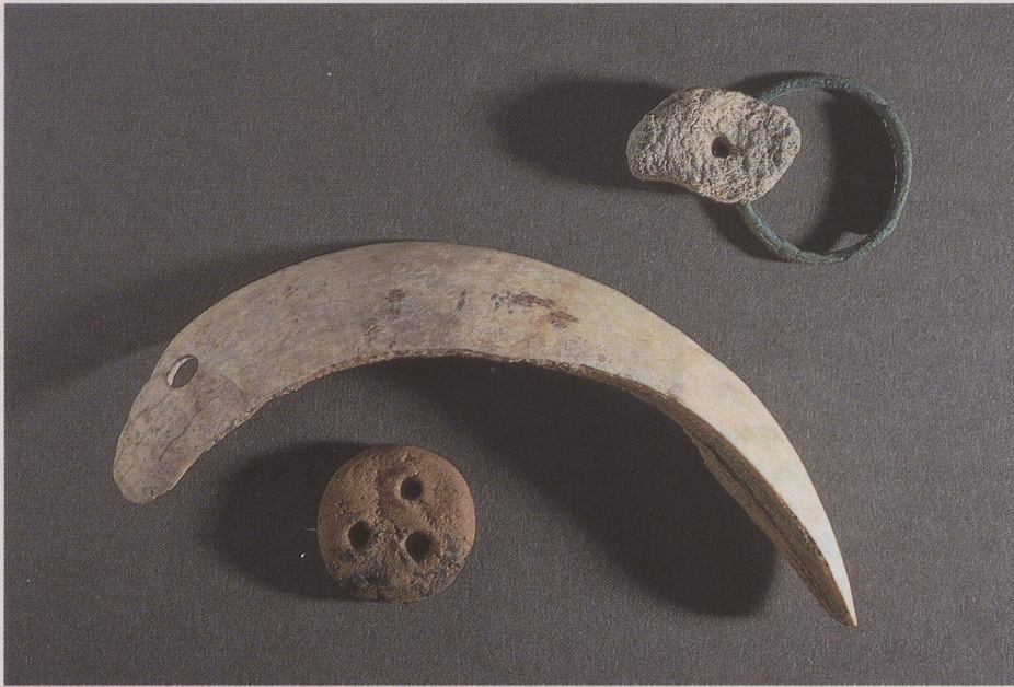
Amulette aus latènezeitlichen Kindergräbern im Keltenfriedhof von Rottenburg, «Lindele-Ost»: Bronzering und durchlochter Stein, ein Eberhauer und eine kleine, dreifach durchbrochene Tonscheibe.