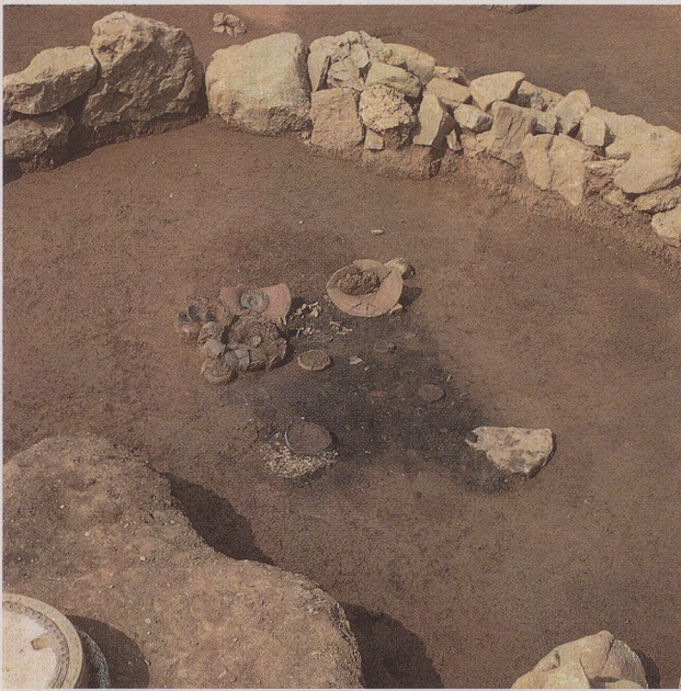
Oben links: Aus der mittleren Hallstattzeit stammt das zentrale Brandgrab unter dem Hügel 60. Oben, beim Geschirr, liegen zwischen den beiden großen, breitrandigen Tellern im «Alb-Hegau»-Stil die Knochen eines Ferkels, das einer erwachsenen Frau als «Wegzehrung» ins Grab mitgegeben wurde. Unten links ist neben dem Leichenbrand der zusammengerollte Gürtel aus Bronzeblech zu erkennen.