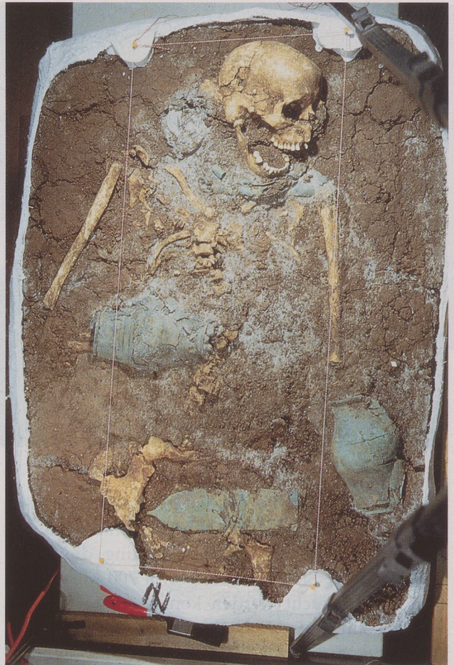
Noch vor der Geburt ihres Kindes ist diese vornehme Frau im 6. Jahrhundert v. Chr. gestorben. Das späthallstattzeitliche Grab wurde in den schon bestehenden Grabhügel 32 im keltischen Gräberfeld von Rottenburg hineingelegt. Der Bronzering um den Hals, die ritzierten Tonnenarmbänder und der mit Bronzeblech beschlagene Gürtel dokumentieren den Reichtum der Toten.

Auch in der Späthallstattzeit sind einige Tote nicht als Leichnam bestattet, sondern eingäschert worden. Brandgrabengräber gibt es in Rottenburg auch aus dem 6. Jahrhundert. Sie sind auch von anderen Fundplätzen her bekannt. Man nimmt an, daß es sich dabei um den ärmeren Teil der Bevölkerung gehandelt hat. Denkbar ist freilich auch, daß es im alten Glauben verwurzelte, dem neuen Zeitgeist abholde Siedler von Rottenburg waren, die Erzkonservativen,