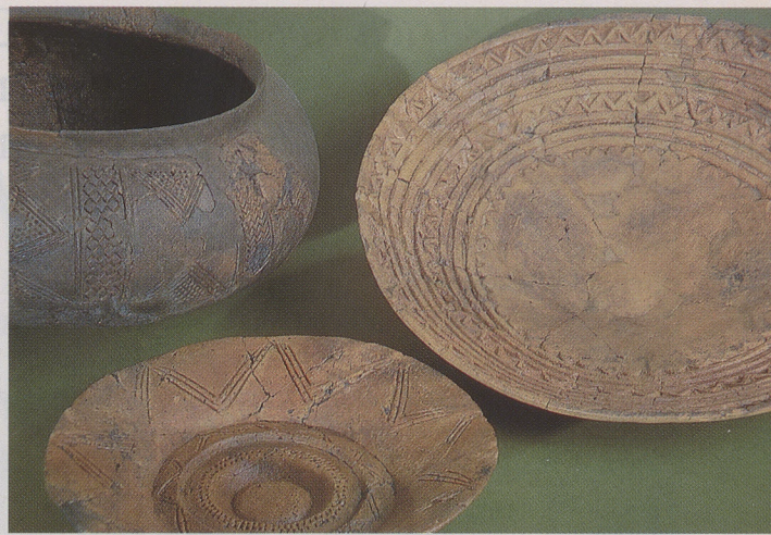
Aus zentralen Brandgräbern der mittleren Hallstattzeit stammen diese ritz- und stempelverzierten, rotbemalten und graphitierten Teller sowie das Gefäß, die für den «Alb-Hegau»-Stil typisch sind.

Die Keltensiedlung in der Talaue am Ostrand Rotenburgs scheint am Ende der Späthallstattzeit, im 5. Jahrhundert, von den Bewohnern größtenteils verlassen worden zu sein. Gräber aus der unmittelbar folgenden Früh-Latènezeit (Latène A) fehlen in der keltischen Nekropole völlig. Ebenso die entsprechenden Siedlungsspuren. Die Toten, die in den wenigen Gräbern aus dem 3. Jahrhundert bestattet wurden, müssen in einem einzelnen Hof an noch nicht bestimmtem Ort gesiedelt haben, denn damals hat das Dorf in «Siebenlinden» mit Sicherheit nicht mehr existiert. Nach dem Sturz der Fürsten der Späthallstattzeit ist hierzulande eine Ausdünnung der Bevölkerung archäologisch festzustellen.