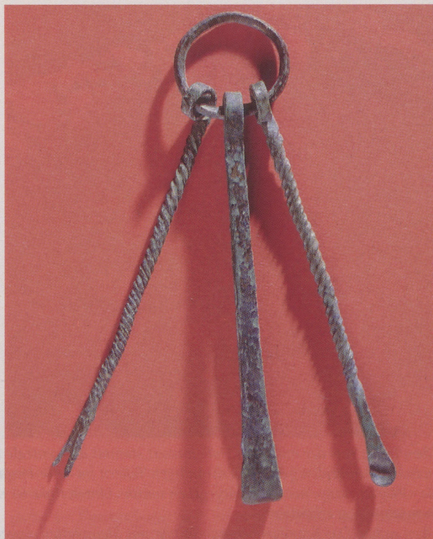
Bronzenes Toilettebesteck als Beigabe im Brandgrabengrab 55. Von links: Nagelschneider, Pinzette und Ohrlöffelchen.

Dem Toten wird der Abschied dadurch leichter gemacht, daß man ihm alles Notwendige für die Reise ins Jenseits oder für das Leben in der Welt der Toten mitgibt. Speis und Trank, das nötige Geschirr, sein Necessaire mit Nagelschneider, Pinzette für die Bartpflege und Ohrlöffelchen, den Schmuck, ohne den die Frau keine Dame von Welt wäre, den Gürtel für festliche Anlässe aus verziertem Bronzeblech