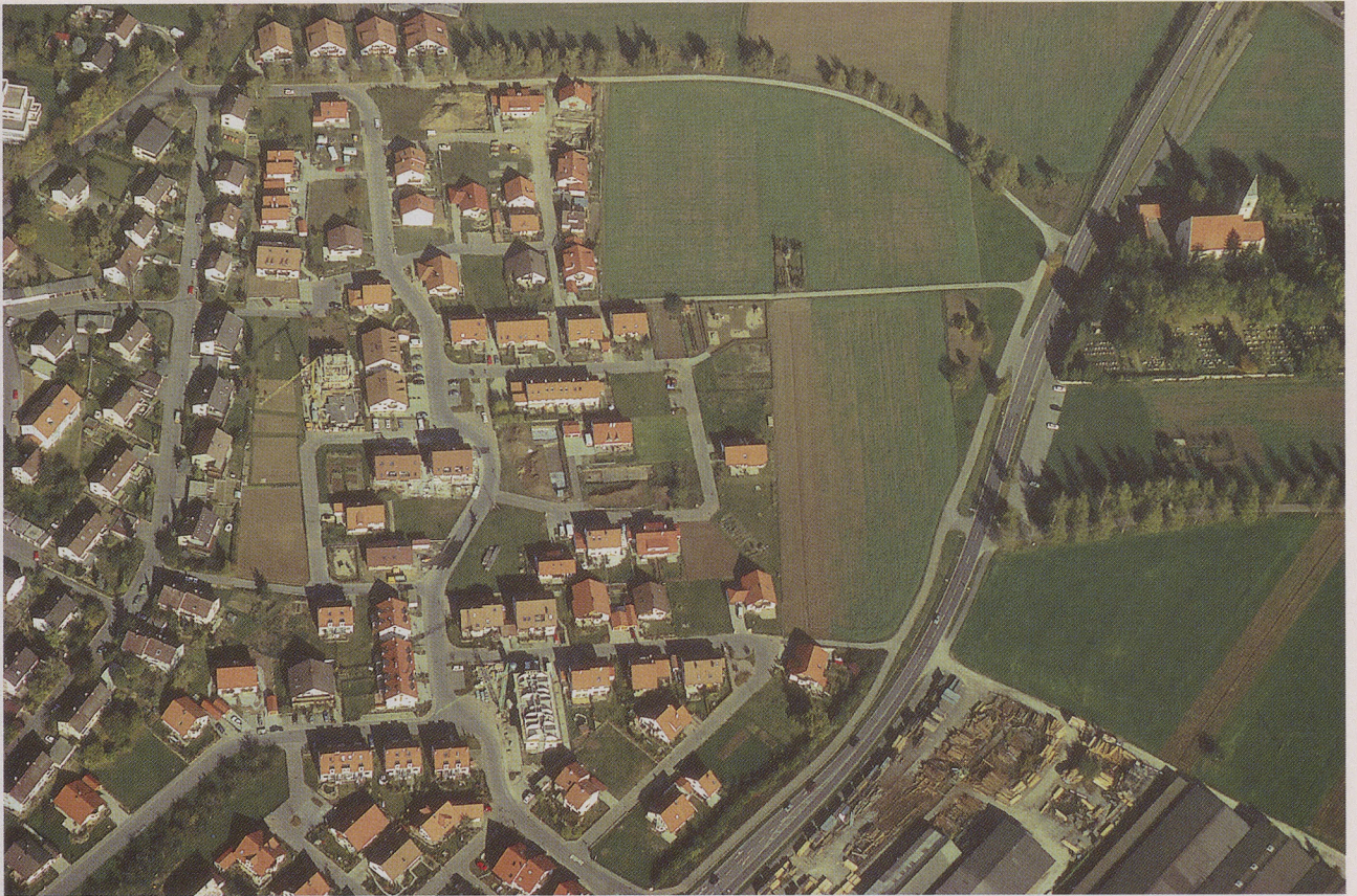
Der keltische Friedhof im «Lindele» (Bildmitte) ist inzwischen überbaut. Rechts oben die Sülchen-Kirche an der Straße von Rottenburg nach Wurmlingen.

Landesgeschichte lassen sich dann einige weitere Steinchen einfügen. Schade nur, daß gerade jetzt, wo die wichtigen Funde in langwieriger und schwieriger Arbeit restauriert werden müssen, um sie auswerten zu können, die Tübinger Werkstatt des Landesdenkmalamts durch Personaleinsparung behindert wird.