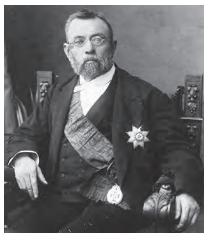
Links Freiherr Ferdinand von Müller (1825–1896), Direktor des botanischen Gartens in Melbourne. Seine wissenschaftliche Arbeit trug Müller zahlreiche Ehrungen ein, die er auch mit Stolz zu tragen wusste. Rechts Ferdinand von Krauss (1812–1890), Direktor am Königlichem Naturalienkabinett in Stuttgart, der jahrzehntelang alle Hebel in Bewegung setzte, um die biologischen Sammlungen des Museums zu erweitern.