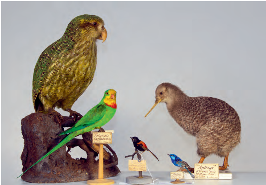
Einige der mehreren hundert hervorragend erhaltenen Vogelpräparate aus Australien und Neuseeland, gestiftet von Ferdinand von Müller. Links der flugunfähige Eulenspapagei oder Kakapo (« Strigops habroptilus »), dessen Weltbestand im Jahr 1995 einen Tiefstand von 50 Individuen erreicht hatte, rechts ein Zwergkiwi (« Apteryx owenii »), die kleinste und seltenste der fünf Kiwiarten Neuseelands.

Staates» (die auch Kunstsammlungen und Bibliotheken umfassten) nach Stuttgart zurück und hatte wesentlichen Anteil daran, dass das Naturalienkabinett einen Neubau und damit eine dauerhafte Bleibe erhielt. Die Ära der hauptamtlichen Wissenschaftler am Naturkundemuseum begann allerdings erst 1856. Geprägt wurde das Museum in dieser Zeit von zwei Persönlichkeiten, dem Zoologen Ferdinand Krauss (1812–1890; am Museum von 1840–1890) und dem Paläontologen Oscar Fraas (1824–1897; am Museum von 1855–1894). Sie legten das Fundament für die heutige internationale Strahlkraft des Stuttgarter Naturkundemuseums (Lampert 1896, Rauther 1940, Schmid 2016).