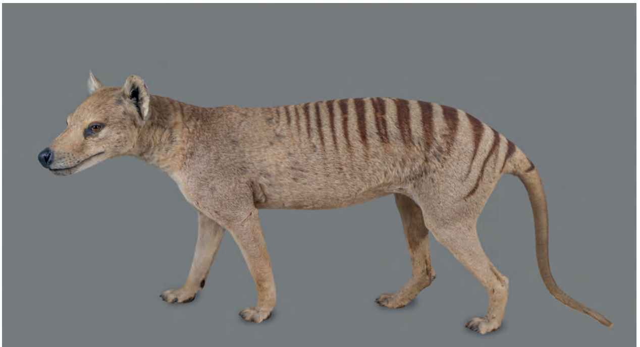
Der Beutelwolf (« Thylacinus cynocephalus ») oder Tasmanische Tiger war der größte Beutegreifer unter den Beuteltieren. In historischer Zeit war sein Vorkommen auf Tasmanien beschränkt. Zeittypisch wurde er als «Raubtier» erbarmungslos verfolgt, ab 1830 wurden Prämien für die Erlegung ausgesetzt. Das letzte Exemplar dieser faszinierenden Art starb 1936 in einem Zoo. Übrig blieben Museumspräparate. Der Beutelwolf im Stuttgarter Naturkundemuseum gilt weltweit als eines der besten.

umfasste. Für jedes dieser drei Naturreiche war ein «Aufseher» zuständig, ein Wissenschaftler, der gleichzeitig an der Hohen Karlsschule lehrte, einer Art Kaderschmiede des Herzogs. Leider hatte diese zukunftsweisende Struktur nur kurz Bestand. Carl Eugen starb 1793, ein Jahr später löste sein Nachfolger die Hohe Karlsschule auf. Der bei der Neuordnung für das Regnum animale gewonnene renommierte Naturwissenschaftler Carl Friedrich Kielmeyer folgte 1796 einer Berufung als Professor für Chemie und Botanik an die Universität Tübingen. Die naturkundlichen Sammlungen wurden wieder nebenamtlich verwaltet, litten unter wechselnden Zuständigkeiten, ständigen Umzügen und Museumskäfern. Erst im 19. Jahrhundert konsolidierte sich die Institution und nahm einen beispiellosen Aufschwung. Zweierlei spielte dabei eine entscheidende Rolle: Die Errichtung eines eigenen Gebäudes für das Naturalienkabinett im Jahr 1826 und eine zunehmende Professionalisierung der wissenschaftlichen Arbeit. Kielmeyer kehrte 1817 als «Direktor der wissenschaftlichen Sammlungen des