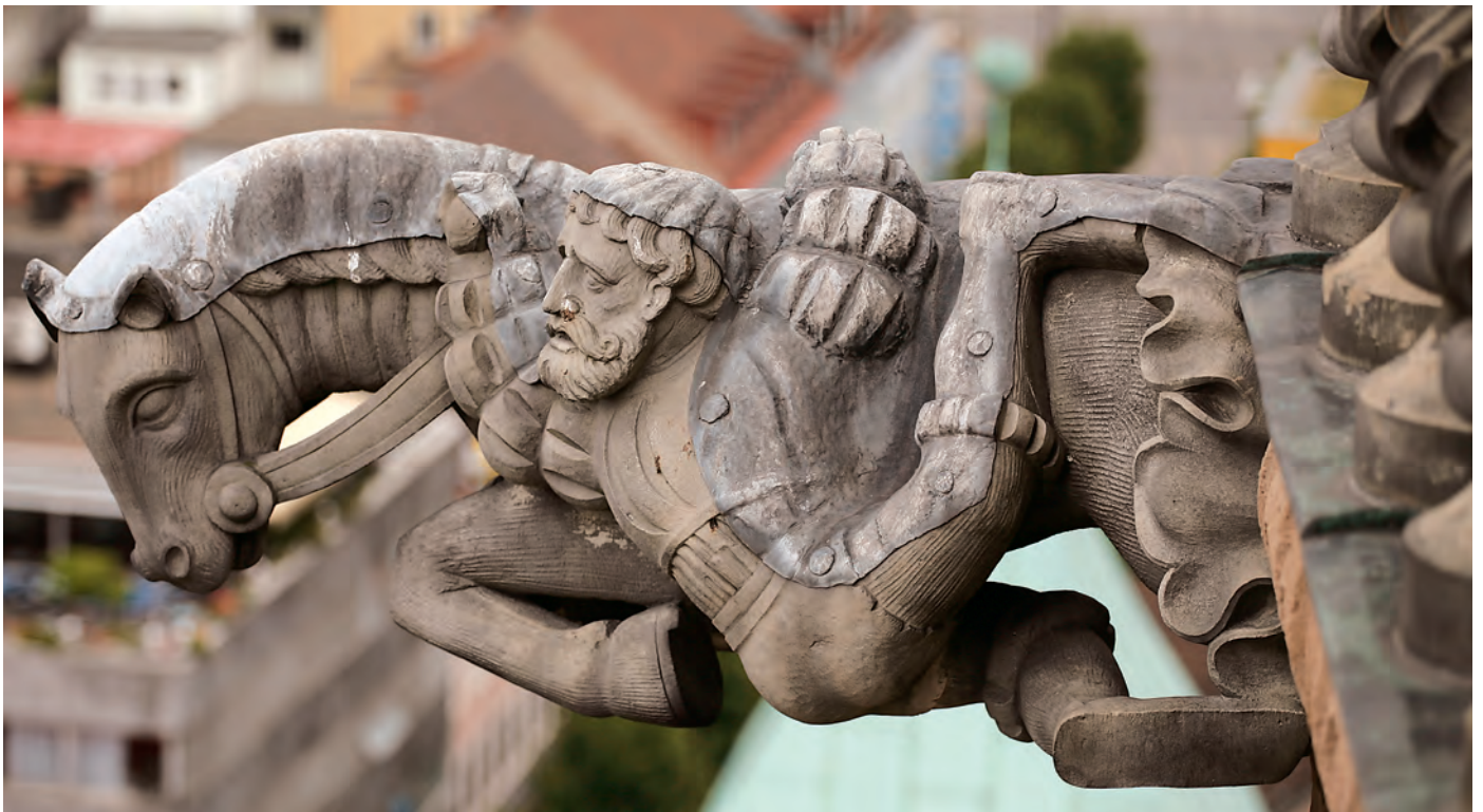
Hochmut kommt vor dem Fall: ein vom Pferd gefallener Reiter als Wasserspeierfigur am Turm. Vermutlich ist hier einer der Deutschordensherren gemeint, deren Kommende in Sichtweite des Turms liegt.

Geschichte der Stadt Heilbronn, 17, Heilbronn 2006, S. 49–118, hier: S. 99 f.