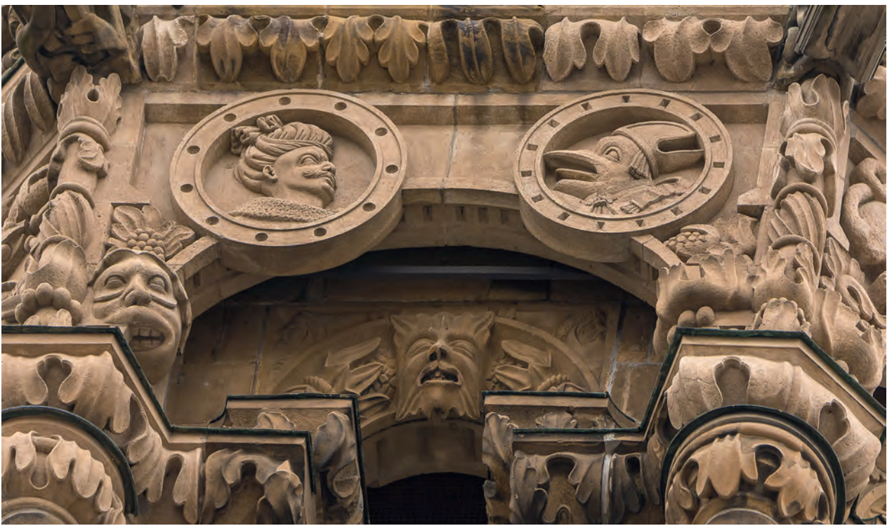
Bezüge zur aktuellen Politik um 1520/30: Ein Medaillon zeigt einen Kopf mit Turban, der als Porträt Sultan Süleymans I. identifiziert wurde. Dieser lag bis 1529 mit seiner Armee vor Wien. Ihm gegenüber ein Medaillon mit einem vogelköpfigen Bischof. Beides sind Symbole der Bedrohung des Abendlands.

gerichtet: so z.B. ein Mönch mit gespaltener Zunge, ein Kleriker mit Narrenkappe, ein Bischof mit Vogelschnabel oder ein Affe im Nonnengewand. Auch Bezüge zur aktuellen Politik des zweiten Jahrzehnts des 16. Jahrhunderts finden sich an prominenter Stelle des Turms: Zwei große kreisrunde Medaillons sind aus Richtung des Deutschhofes, dem Sitz der Herren des Deutschen Ordens in der Stadt, deutlich mit bloßem Auge zu erkennen: Das eine Medaillon zeigt einen Kopf mit Turban, von Karl Halbauer als Porträt Sultan Süleymans I. identifiziert: Von Sultan Süleyman I. dem Prächtigen, der von 1520 bis 1566 regierte, gibt es einige von westlichen Künstlern geschaffene Bildnisse in Form von Grafiken, Gemälden und Medaillen, die alle auf die gleiche Vorlage zurückgehen. Unverkennbar lag Hans Schweiner solch ein Porträt vor. 2