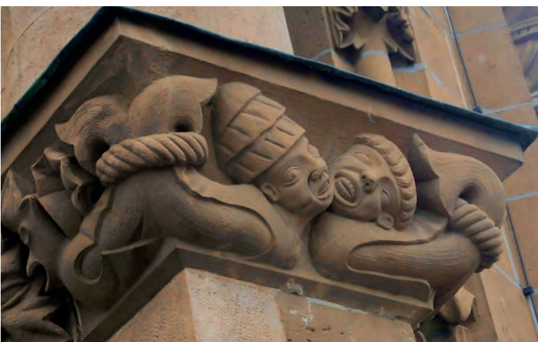
Bauschmuck als antiklerikales Programm: Karikatur von Papst und Mönch mit Fischeschwänzen an Hühnervogel gefesselt.

Die vier folgenden Geschosse sind jedoch über und über mit ornamentaler Bauplastik überzogen, deren Phantasie reichum überrascht. Neben Blattverzierungen auf Balustern und Säulen fallen vor allem die figürlichen Motive auf, als Bogenfriese, Wasserspeier, Medaillons oder Säulenfresser ausgeführt. Eine grazile Wendeltreppe führt bis zur nächsten begehbaren Ebene im dritten Geschoss. Die überlebensgroße Figur eines Wächters mit Horn ist dabei als Fortsetzung des Geländers zur Brüstung hin eingefügt. Krebse, Ungeheuer und verschiedenartige Fabelwesen tummeln sich da oben, dazwischen Karikaturen auf Mönche, Nonnen, Bischöfe, Priester, Gelehrte, allesamt Vertreter der altgläubigen Amtskirche. Ein Großteil der Bauplastik am Turm erscheint als provokantes antiklerikales Programm, gegen die herrschenden Missstände der Amtskirche