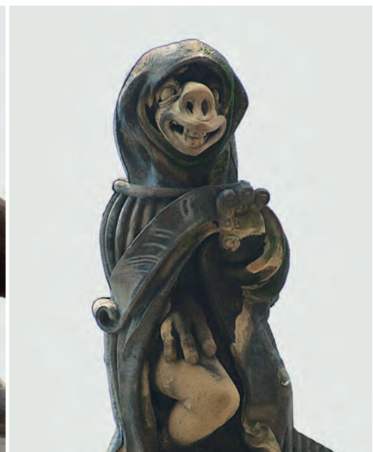
Wasserspeierfigur am Turm. Die Erbsünde kam mit dem Biss Adams in den ihm von Eva – hier mit einem fränkischen Brotlaib – gereichten Apfel in die Welt. Nach protestantischer Sicht kann sie nur durch die Verkündung des reinen Wort Gottes durch die ebenfalls am Turm dargestellten Evangelisten überwunden werden. Adam blickt am Turm auf den Evangelisten Johannes. Der Affe im Nonnengewand ist als Satire auf die Nonnen im Klarakloster unterhalb des Turms zu verstehen.