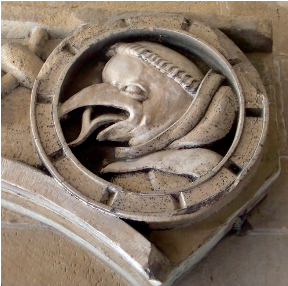
Der Mönch mit der gespaltenen Zunge und Vogelschnabel versteht sich als Anspielung auf die Missstände in den Klöstern.

Messgewand wie früher, der andere seinen Chorrock. Der Pfarrer las die Messe lateinisch, Lachmann deutsch. Der Pfarrer gab Weihwasser, der andere scheute sich davor, als käme es vom Teufel. [...] Zuletzt fraß Lachmann den Pfarrer samt seinem ganzen Anhang. Da musste weichen, was nicht lachmannisch war, oder zur Messe in die Kirche des Deutschen Ordens gehen. 11