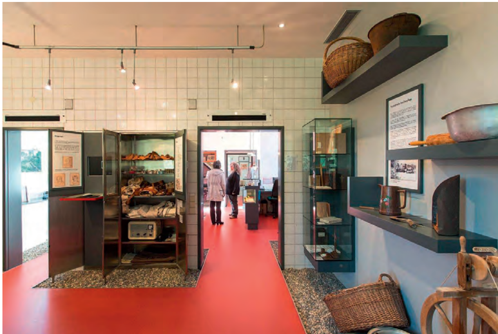
Dauerausstellung des Württembergischen Psychiatriemuseums. Blick in den Raum der ehemaligen Pathologie in Zwiefalten mit Exponaten zu den unterschiedlichen psychiatrischen Therapieformen.

Sonderausstellungen organisiert. Das Museum ist Kooperationspartner des von der Europäischen Union geförderten Projekts der Psychiatriemuseen «Broadening the European Mind».