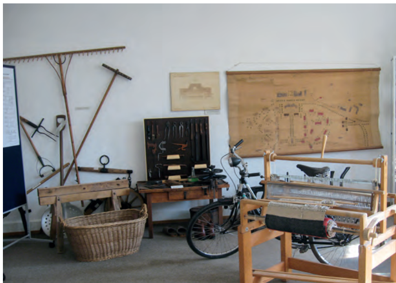
Webstuhl im Psychiatriemuseum auf der Reichenau, der für arbeitstherapeutische Zwecke genutzt wurde.

Die Museumsinitiative des Zentrums für Psychiatrie Reichenau (bei Konstanz): Aus Anlass des 100-jährigen Bestehens der Einrichtung im Jahr 2013 wurde im Hauptgebäude der Klinik ein kleines Museum eingerichtet, in dem interessierte Patienten,