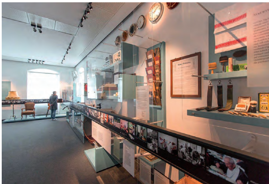
Blick in den Raum zur Geschichte der Psychiatrie in Bad Schussenried.