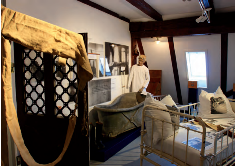
Krankenbett mit Fixiergurt sowie eine Badewanne für die Bäderkur in der Dauerausstellung des MuSeele in Göppingen im Dachgeschoss des Alten Badhauses.

Als vor rund zweihundert Jahren in Deutschland und Europa im Zuge der Aufklärung die ersten seinerzeit sogenannten Irrenanstalten eröffnet worden waren, war dies für die Psychiatrie ein Meilenstein. Erstmals wurden institutionelle Strukturen geschaffen, um psychisch kranke Menschen nicht allein nur zu verwahren, sondern als Kranke zu behandeln, ihnen also auch formal die (jeweils zeitgenössische) Medizin zu öffnen – und sie als Patientinnen und Patienten, nicht mehr als «Böse», «Kriminelle» oder «Besessene», wenn möglich gar zu heilen. Von Anfang an herrschte jedoch zugleich ein großes Misstrauen gegenüber diesen staatlichen Einrichtungen. Es speiste sich aus der Unkenntnis über psychische Erkrankungen, auch aus ihrer «Natur» und ihrem symptomatischen Erscheinungsbild, oder gar aus der Furcht, selbst eines Tages in eine «Anstalt» eingewiesen zu werden, in welcher dem Hörensagen nach – und etwas zugespitzt formuliert – ein Regiment von Angst und Schrecken an der Tagesordnung sei: Überfüllte Bettensäle, die Zwangsjacke, späterhin Zwangsmedikation und im 20. Jahrhundert Elektroschocks ohne Vollnarkose waren und sind Symbole für eine öffentliche Wahrnehmung der Psychiatrie in der Gesellschaft, die selbst im 21. Jahrhundert, trotz Reformen der Psych-