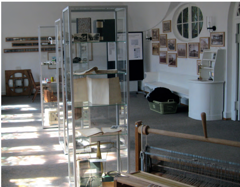
Blick in die Dauerausstellung des Psychiatriemuseums im Zentrum für Psychiatrie Reichenau.

Justinus Kerner-Haus (Weinsberg): In Weinsberg ist unweit der sagenumwobenen Burgruine Weibertreu das, wenn man den Worten des Theologen David Friedrich Strauss Glauben schenken mag, merkwürdigste und eigentümlichste Haus in ganz Schwaben zu besichtigen. In diesem Anwesen, in dessen Garten der ebenfalls zu besichtigende «Geisterturm» steht, lebte und arbeitete über mehr als vier Jahrzehnte der Arzt, Seelenforscher und Dichter Justinus Kerner (1786–1862), nach dem auch eine Weinrebe benannt wurde. Das Kernerhaus wurde im 19. Jahrhundert zu einem Treffpunkt der schwäbischen Romantik. Die Biographie Kerners, die Epoche der Romantik sowie die zeitgenössische Medizin und Seelenkunde sind Inhalte der Ausstellung.