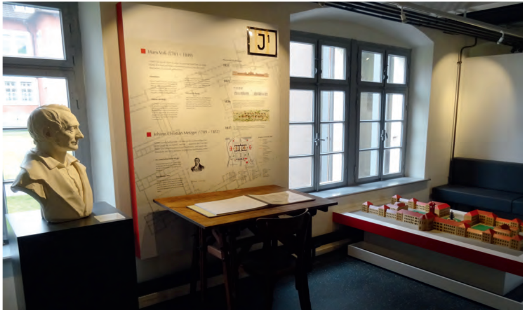
Die Dauerausstellung zur Geschichte der Psychiatrie in der Illenau und in Baden befindet sich auf zwei Stockwerken in den Arkaden der Illenau.

in der erfolgreichen Wanderausstellung zu Leben und Werk des bekannten Neuroanatomen widerspiegelt. An beiden Beispielen wird deutlich, wie wichtig es ist, Psychatriegeschichte lokal anzubinden und die Inhalte der Ausstellungen dennoch «wandern» zu lassen, um – dem selbst gewählten Bildungsauftrag folgend – das Museum zu den Menschen zu bringen, Hürden abzubauen, Berührungspunkten zu begegnen. Wie verwurzelt der Gedanke der Kooperation und der Vernetzung der in diesem Beitrag beschriebenen Initiativen ist, zeigt nicht zuletzt auch der Mitte der neunziger Jahre gegründete Arbeitskreis Psychatriegeschichte Baden-Württemberg. Er bildet eine gemeinsame Plattform, auf welcher sich klinisch-psychiatrisch-Tätige, Fachhistorikerinnen und -historiker, Museumsmacher und interessierte Laien im südwestdeutschen Raum austauschen können. Er richtet jährlich regionalgeschichtliche Tagungen aus und sieht seinen wesentlichen Zweck in der Vernetzung und der Zusammenführung von Wissen und Erfahrungen. Die Jahrestagung 2016 war unter anderem der Thematik der Psychatriemuseen gewidmet. Dieser Beitrag stellt eine Vielfalt originär psychiatriehistorisch ausgerichteter, musealer Orte in Baden-Württemberg vor und gibt einen Überblick über Gedenkstätten, die als dem Feld der Psychatriegeschichte assoziiert bezeichnet werden dürfen.