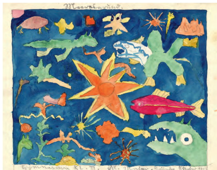
Aquarell «Meeresgrund», von Magdalene gemalt als Schülerin des Georgii-Gymnasiums, Klasse III, Oktober 1929.

Eine aus Esslingen stammende Frau wurde nach Einstellung der Gasmorde in Hadamar auf unbekannte Weise ermordet. Die Zahl weiterer Männer, Frauen und Kinder, die im Zuge dieser als regionale Euthanasie benannten Mordaktion durch Gabe von