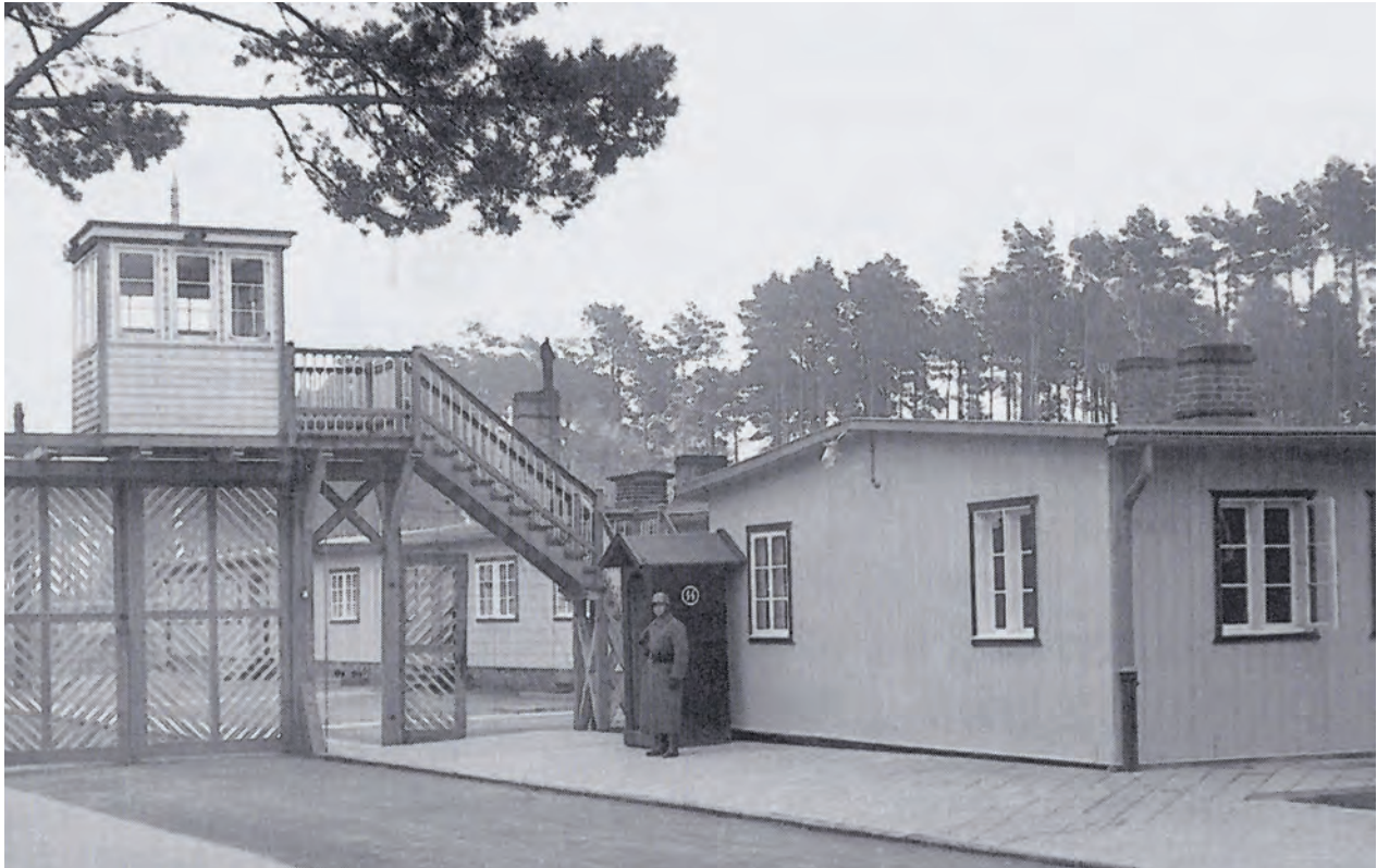
Eingang des KZ Stutthof bei Danzig um 1941.