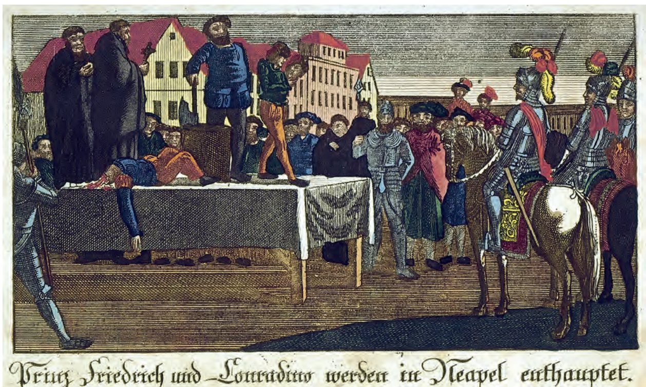
Die Hinrichtung Konradins. Kolorierter Kupferstich aus Emils Bilderbuch, Meißen 1827.