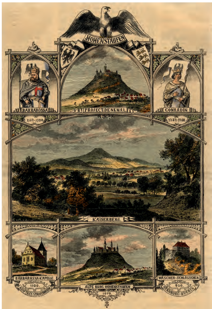
«Der Hohenstaufen mit seinen Umgebungen und dem Projekt des Ausbaus». Gedenkblatt für den Plan eines Nationaldenkmals auf dem Hohenstaufen von 1871.

Nach der Reichsgründung von 1871 gab es dann kein Halten mehr. Das Bild des erwachenden oder erstandenen Barbarossa und der Hohenzollern als Staufer-Nachfolger avancierte zum einprägsamsten Bild der Reichsgründungsära 9 . Auf Felix Dahn geht die parallele Bezeichnung Barbablanca (Weißbart) für den neuen Kaiser Wilhelm I. zurück. Den monumentalsten Ausdruck fand die Gleichsetzung in dem 1896 eingeweihten Kyffhäuser- oder Barbarossadenkmal. Die riesenhafte Anlage, dem verstorbenen Kriegsherrn Wilhelm I. gewidmet, war zugleich eine