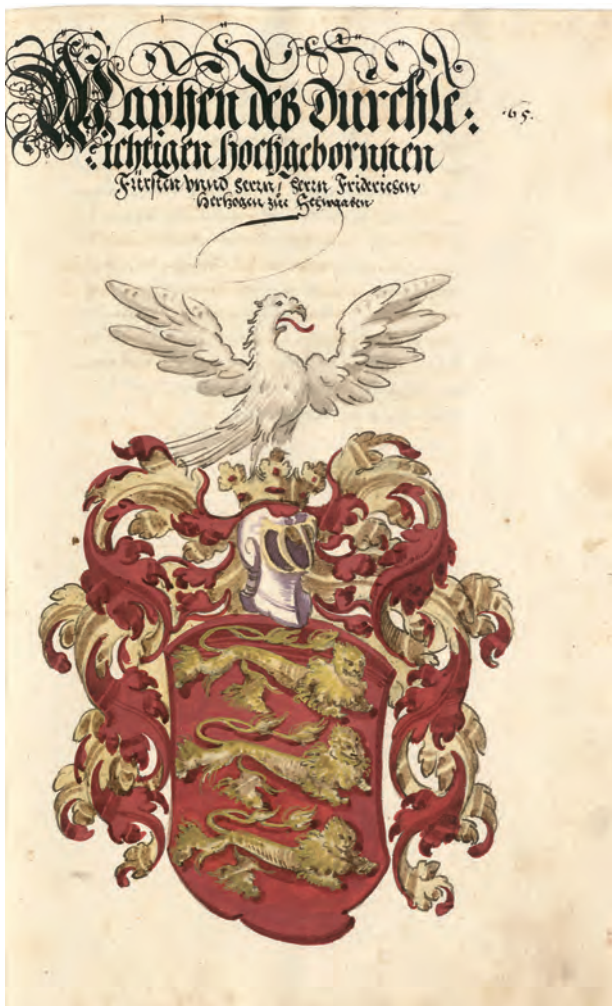
«Wapfen des durchleichtigen hochgebornnen Fürsten unnd Herrn, Herrn Friderichen, Hertzogen zue Schwaaben». Aus der Stauferchronik von David Wolleber, 1581.

das mächt'ge Europa, | Asiens blutig Gefild beugte sich ihrer Macht 1 .