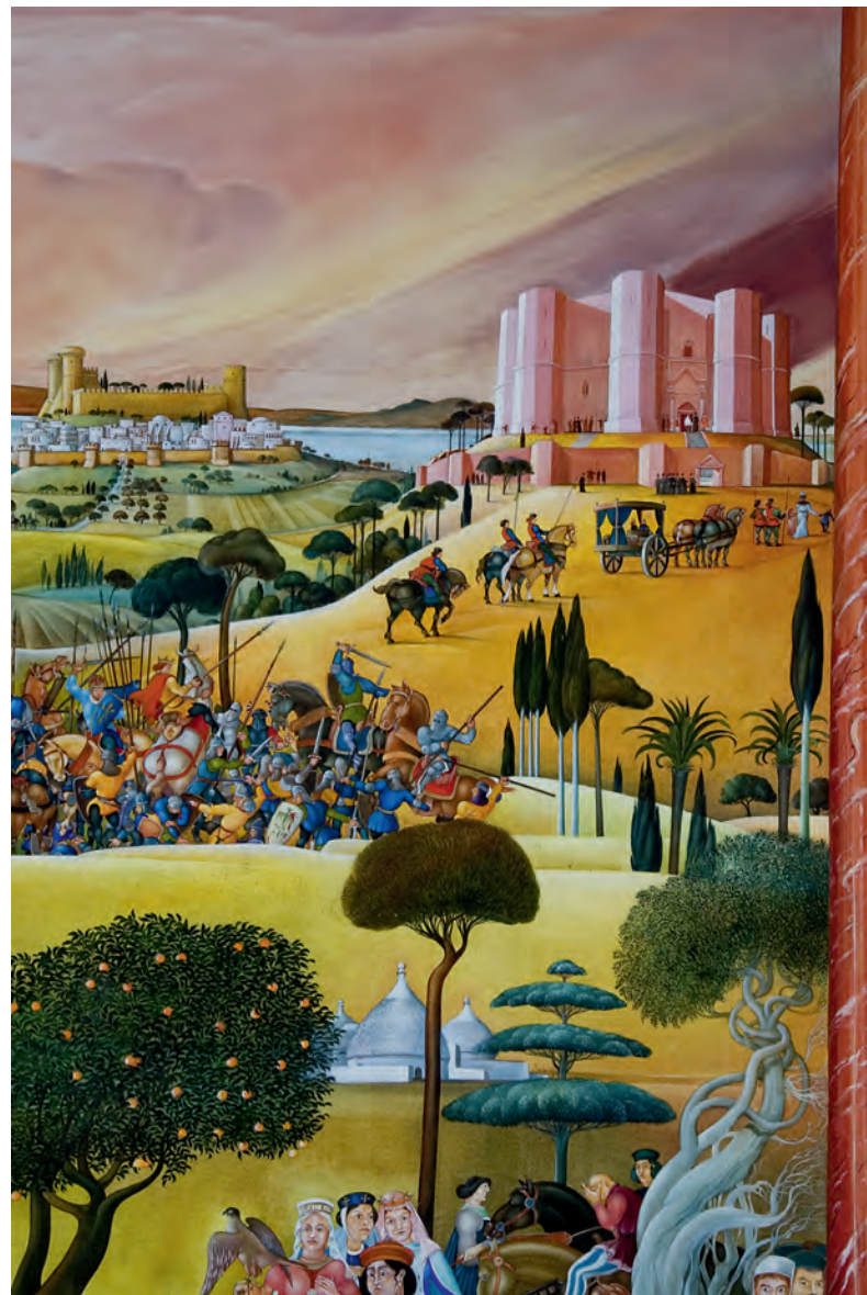
Castel del Monte, Ausschnitt aus dem Lorcher Stauferrundbild von Hans Kloss.

Lorch eröffnet wurde und in zehn Stationen die staufische Geschichte von 1102 bis 1268 Revue passieren lässt. Man hat den historischen Kapitelsaal damit befüllt, der historische Raumeindruck ist dahin, aber immerhin hat der Maler über 600 Tiere, davon die Mehrzahl Pferde, naturgetreu dargestellt. Es ist ein Kunstwerk des Superlativs, 30 Meter lang und 4,5 Meter hoch und das größte Gemälde auf Leinwand in Südwestdeutschland.