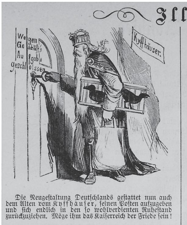
Barbarossa-Karikatur im «Kladderadatsch», 1871. Der Stauferkaiser macht Platz für den deutschen Kaiser Wilhelm I. von Preußen.

Kampfansage der Kriegervereine gegen die deutsche Sozialdemokratie.