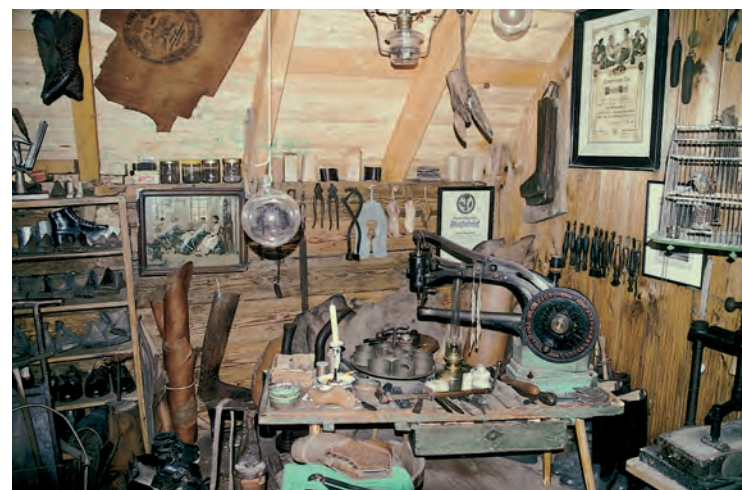
Eine Schuhmacher-Werkstatt aus alten Zeiten.

Ganz nebenbei erfährt man die Entstehung von Redewendungen aus der dörflichen Arbeitswelt –