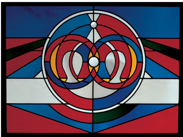
Unten: Am sechsten Tag ist die Erschaffung der Menschen: Gemeinsam sind Frau und Mann Gottes Ebenbild.

äußeren Ausdruck in den Entwürfen fanden und schließlich in Licht und Glas umgewandelt wurden durch das Atelier für Glasmalerei Valentin Saile in Stuttgart.