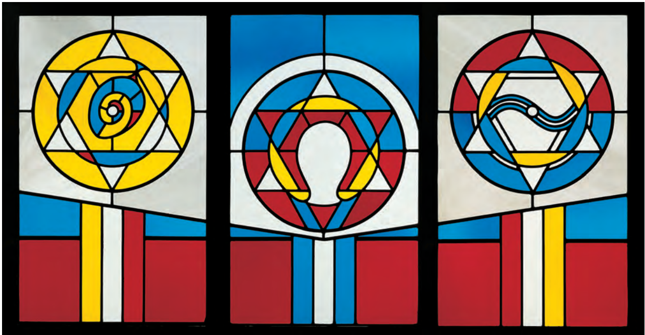
Die drei Fenster der Trinität: Vater, Sohn und Heiliger Geist.