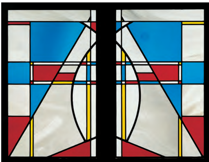
Zwei Fenster bilden die Kreuzigung ab.

Herausragend sind die drei schmalen Fenster mit der Trinität. Nur eine Person trägt ein Gesicht: der