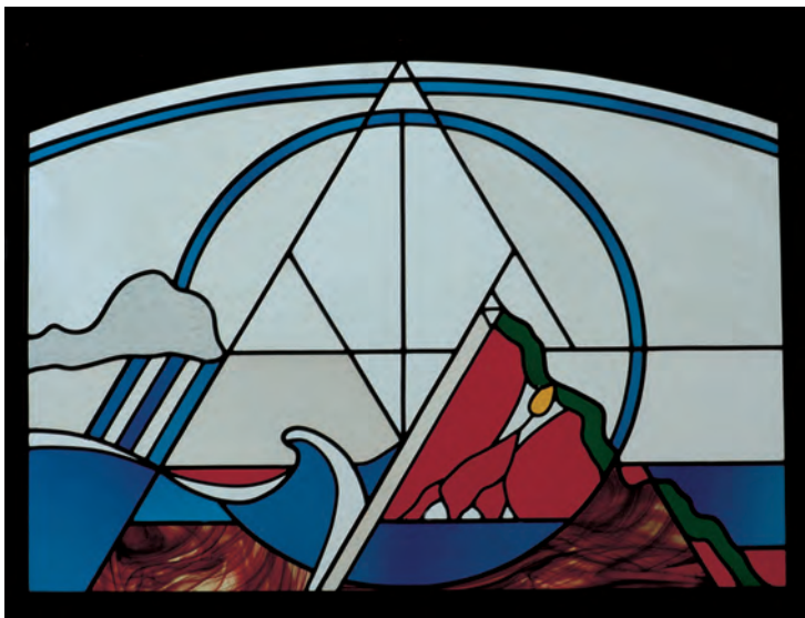
Am dritten Tag taucht die Erde als Berg auf dem Wasser auf, rotglühende Lava drängt nach oben.