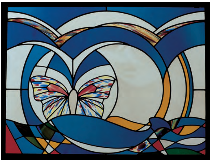
Oben: Am fünften Tag beginnt es, im Wasser und in der Luft von vielerlei Tieren zu wimmeln.