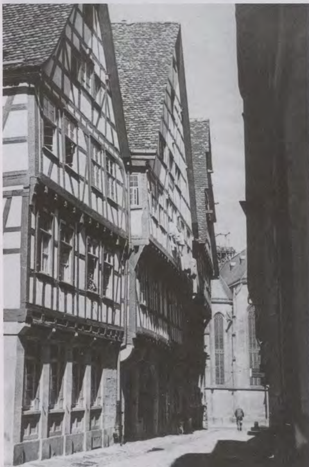
Unten: Das Geburtshaus von Adolf Cluss in der Heilbronner Altstadt vor der Zerstörung der Stadt im letzten Weltkrieg.

Heilbronn war im 19. Jahrhundert eine dynamisch wachsende Stadt, offen für Innovationen, politisch aufgeklärt und liberal geprägt. Die städtischen Eliten hatten die Chancen erkannt, die sich der ehemaligen Reichsstadt nach 1803 boten – das Kapital der Großhandelshäuser floss in frühindustrielle Unternehmungen, die Verkehrswege wurden gezielt ausgebaut, die Stadt zog Arbeitskräfte aus dem Umland an und war gegen Ende des Jahrhunderts Industriemetropole im Südwesten.