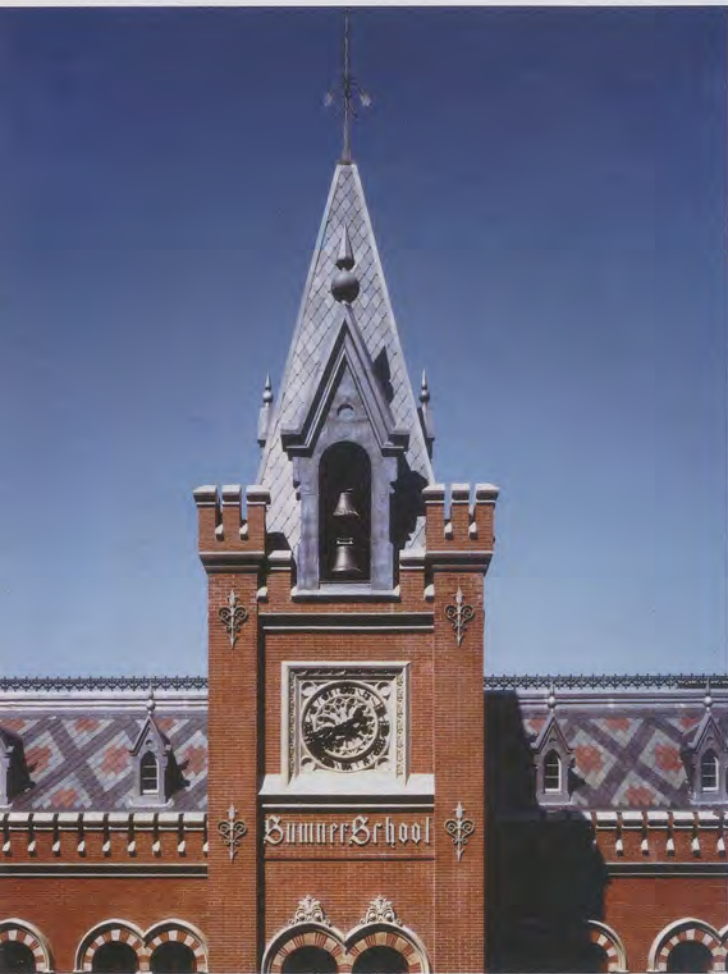
Der Uhrturm der von Adolf Cluss entworfenen Charles Sumner School, heute Archiv und Museum sowie der Ort der Adolf-Cluss-Ausstellung in Washington D.C.

fangen, auch keinen einzigen zuverlässigen Menschen in ganz Amerika. 21