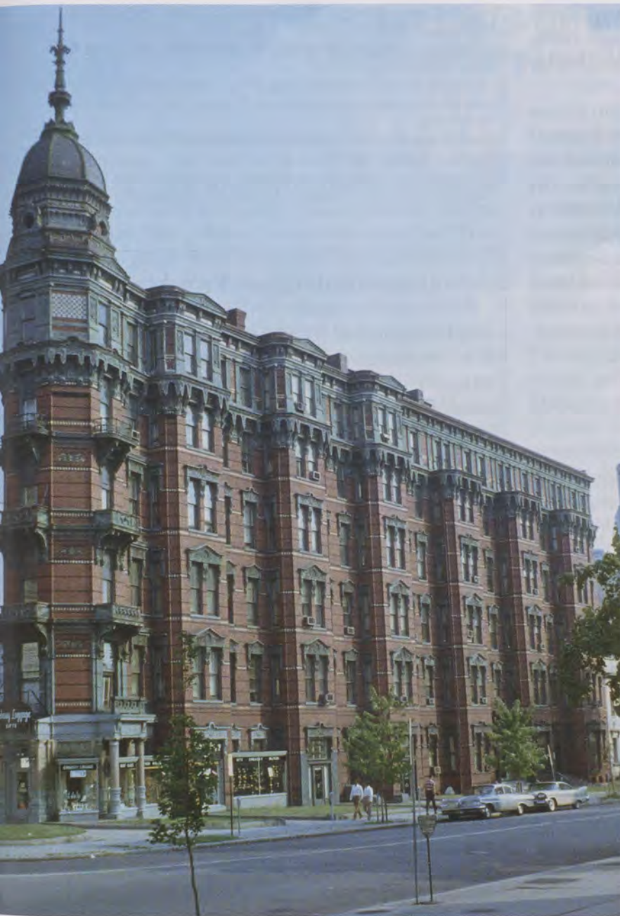
Portland Flats, von Adolf Cluss 1880 entworfen, 1962 abgerissen.

Seit 1867, mit der Planung und dem Bau des US-Landwirtschaftsministeriums, war Cluss an einigen Regierungsgebäuden beteiligt. Weitere Entwürfe für öffentliche Gebäude waren der Center Market (1871/72) als zentrale Markthalle der amerikanischen Bundeshauptstadt und der Eastern Market (1873), die älteste Markthalle, die sich in Washington erhalten hat und noch heute als solche betrieben wird. Etliche Stadthäuser entstanden in privatem Auftrag, richtungsweisend waren etwa Phillips Row (1878) und Portland Flats (1880) als erstes Apartmenthaus in Washington D. C. Als Adolf Cluss 1890 seine aktive Laufbahn als Architekt beendete,