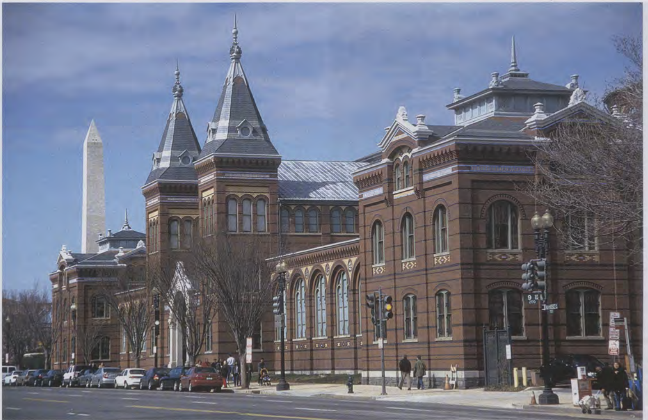
Adolf Cluss baute das erste Nationalmuseum der USA, heute Arts and Industries Building an der Mall in Washington D.C.

bequeme Stellung an den Nagel hängen, wenn das Vaterland ruft. Ich fühle hier, in Washington ungeheuer den Mangel einer mir passenden Gesellschaft u. lebe deshalb ziemlich abgeschlossen für mich allein. 15