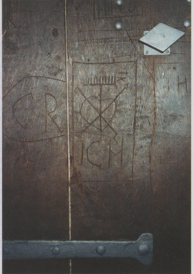
Türinnenseite in Zelle 2, der Frauenzelle. Die Gravuren sind spärlicher als bei den Männern. In der Mitte eine originelle Darstellung von Frau «ICH» mit Herz, Pfeil, Rechen und Haken.