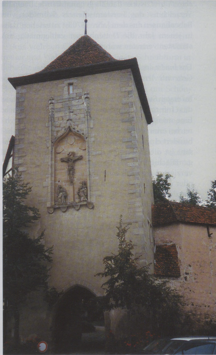
Durch den Schreibturm, an dessen Schauseite eine Kreuzigungsgruppe zu sehen ist, betritt man das Innere des Klosters Bebenhausen.

Die Ablösung der Waldnutzungsrechte erfolgte für Dettenhausen erst 1873. Gegen eine Geldabfindung verlor Dettenhausen die Weide- und Streunutzungsrechte, ebenso die Brennholzbezugsrechte. Lediglich das Leseholzrecht blieb erhalten. Da der Nutzholzbestand des Dettenhausen zugewiesenen Gemeindewaldes sehr kümmerlich war, war der Waldfrevel schon von Anfang an vorprogrammiert. Die Forstverwaltung hat durch Verbote und entsprechende Strafen versucht, den Waldfrevel zu begrenzen. Unter dieses Verbot fiel beispielsweise die Gewinnung von Laubstreu, das Seegrasschneiden,