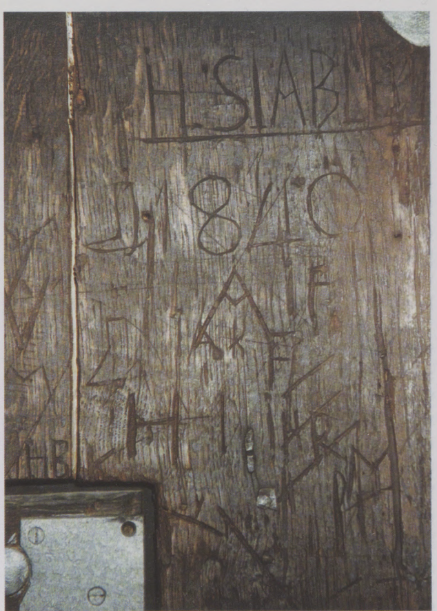
Die Jahreszahl 1840 zeigt, dass die Namensgravuren unterschiedlichen Alters sind. Der Name darüber kann als H.S.ABLE oder H.S.ÄBLE gelesen werden.

Vom 1. Juni morgens 7 Uhr bis zum 30. Juni 1870 abends 8 Uhr war der Schreibturn durchgehend mit Waldfrevlern belegt. 35 Personen waren in diesem Zeitraum im Turm eingesperrt, und zwar 25 männliche und zehn weibliche Delinquenten. Die fünfzehn Herkunftsorte der Eingesperrten lagen wie in den Vormonaten rund um den südlichen Schönbuch. Auch die Aufteilung nach bestimmten Berufsgruppen hat sich gegenüber den Vormonaten nicht wesentlich geändert. Die Tagelöhner, Weber, Schuster, Bäcker, Holzmacher, Küfer, Hafner stellten das Hauptkontingent. Aber auch ein Silbersandhändler gehörte dazu. Und genau dieser, der Binder Johannes aus Altdorf , machte am 1. Juni 1870 den Anfang unter den Eingethürmten in Bebenhausen. Er musste für 1 ½ Tage in Zelle 1 einsitzen und dafür 46 Kreuzer