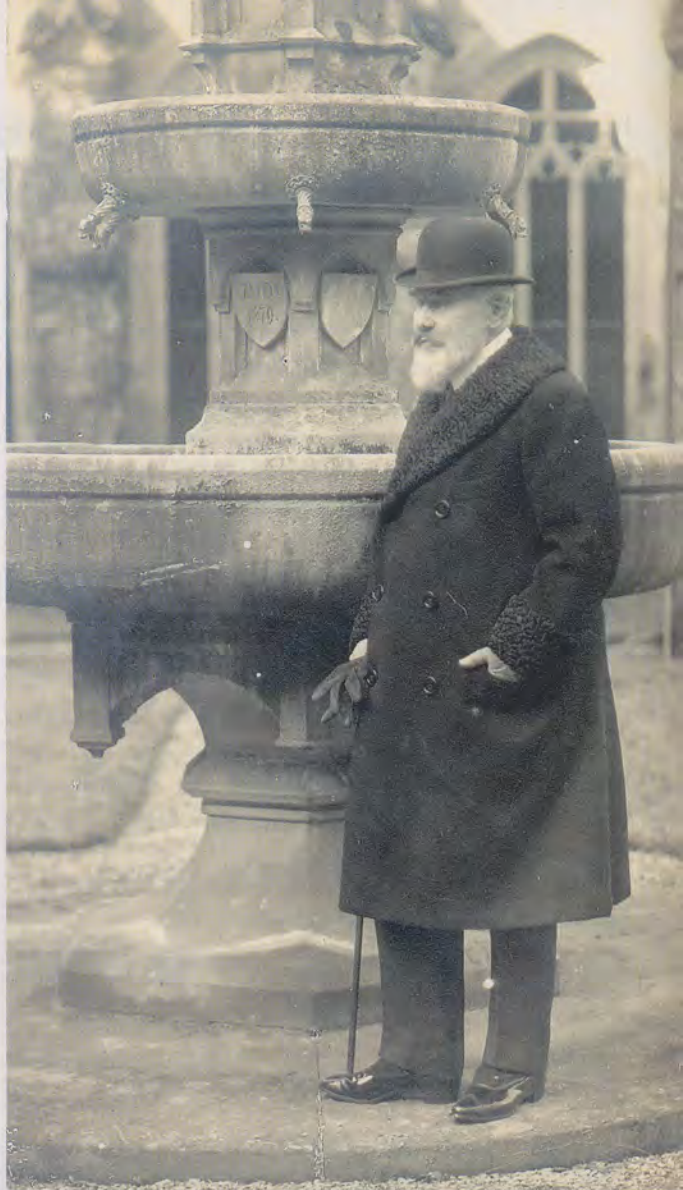
König Wilhelm II von Württemberg im Kreuzgang von Bebenhausen, Foto um 1920.

Die reformatorischen Maßnahmen mussten besonders auch die Klöster betreffen, weil der mönchischen Lebensform kein Vorzug vor der weltlichen mehr zuerkannt wurde. Die Klöster sollten daher aufgehoben werden. Die in Württemberg wohl anfangs gehegte Hoffnung, dass Mönche und