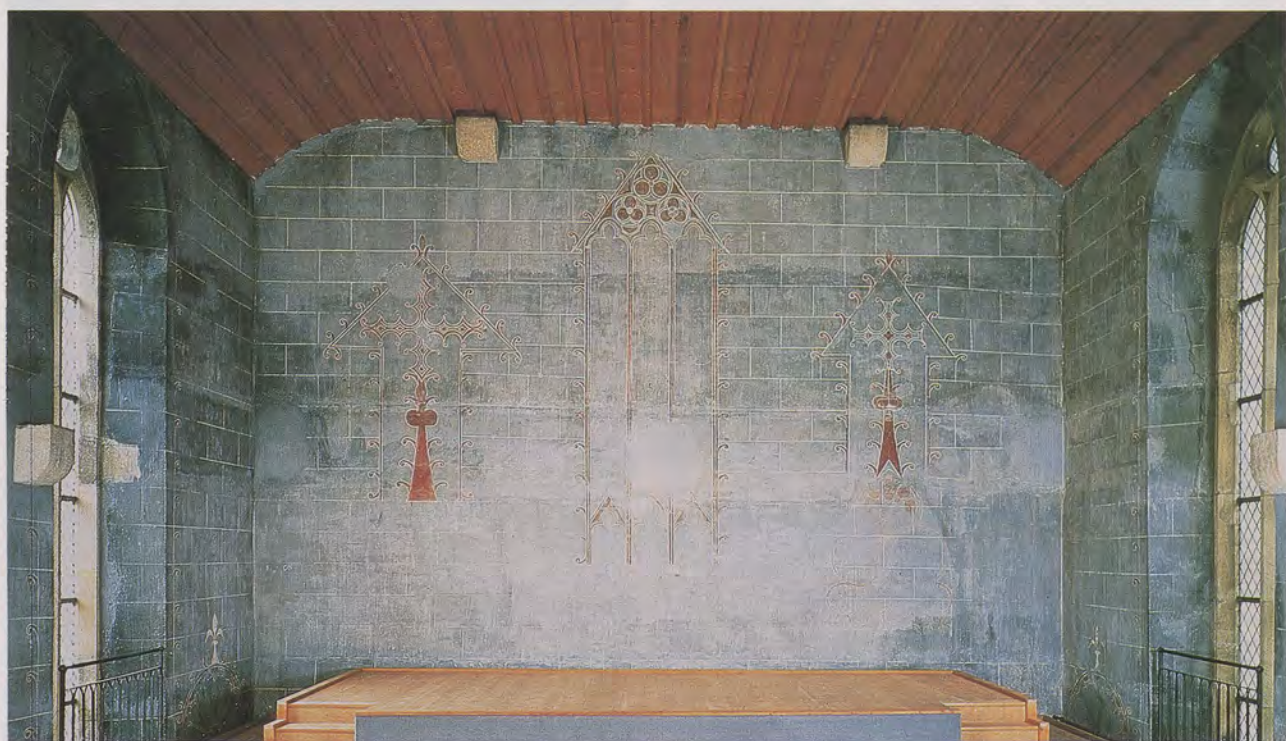
Blick in die Kirche des ehemaligen, 1539 aufgehobenen Klarissenklosters in Pfullingen: Trotz des Einbaus von Zwischenböden und trotz Nutzung der Kirche bis 1845 als Fruchtkasten – zunächst des württembergischen Klosteramts, dann des Kameralamts Pfullingen – blieb die wertvolle frühgotische Wandmalerei erhalten.

Freilich hat es schon immer Säkularisationen gegeben, so unter den Karolingern, in der Reformationszeit und durch den Westfälischen Frieden 1648. Doch ist wohl nur die Säkularisation von 1802/03 so geschichtsmächtig, dass sie noch bis zum heutigen Tage nachwirkt. Allerdings ging es damals nicht nur um den Übergang geistlicher Herrschaften in weltliche Hand, es muss nämlich daran erinnert werden, dass gleichzeitig auch die allermeisten Reichsstädte mediatisiert wurden. An diesen Sachverhalt erinnert die Wanderausstellung zum Ende der reichsstädtischen Freiheit 1802 mit dem Titel «Kronenwechsel», die zurzeit im Braith-Mali-Museum in Biberach zu sehen ist. Stellt also die Eingliederung der Reichsstädte in die Territorialstaaten gleichsam ein Nebengeschehen der Säkularisation von 1802/03 dar, so wird der unbefangene Beobachter aus allen anderen Umständen schließen müssen, dass es sich bei der in den beiden oben genannten Ausstellungen vor Augen geführten Säkularisation um ein Ereignis