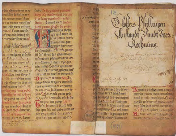
«Jars-Rechnung» des herzoglichen «Klosteramts Pfullingen», eingebunden mit Pergament einer Handschrift aus der Bibliothek des aufgehobenen Klosters.

Dieser Eindruck wird zunächst unterstützt durch das vor einem Jahrhundert, im Jahre 1902, erschienene Buch des württembergischen Zentrumspolitikers und späteren Reichsfinanzministers Matthias Erzberger (1875–1921) mit dem Titel Die Säkularisation in Württemberg von 1802-1810 . Erzberger hatte als gewandter Publizist den Zeitpunkt für das Erscheinen seines Buches richtig gewählt: hundert Jahre lagen zurück, seitdem die Säkularisation die katholische Kirche auf dem Gebiet des nachmaligen Königreichs Württemberg grundlegend verändert hatte. Erzbergers eingehende Darstellung des Endes einer so großen Anzahl von Institutionen der katholischen Kirche auf dem Gebiet des damals entstandenen Königreichs stellt eine Verlustgeschichte dar. Sie ist also zugleich eine Anklageschrift, die man im Zusammenhang des sich durch das ganze 19. Jahrhundert erstreckenden Kampfes der katholischen Kirche gegen die ihr vom Staat auferlegten Fesseln sehen muss.