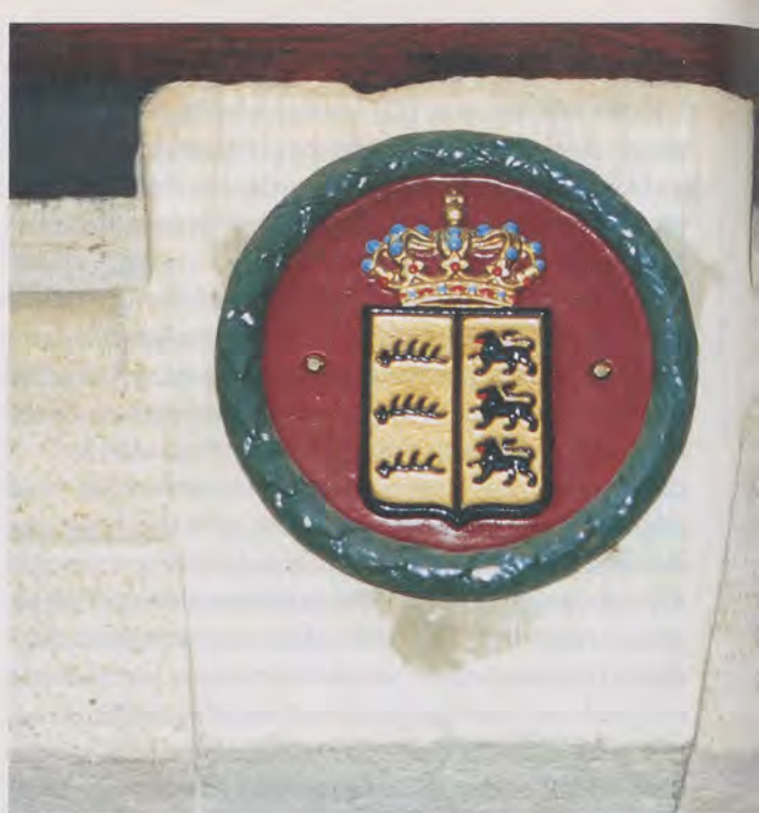
Eine sichtbare Erinnerung an die Säkularisation des evangelischen Kirchenguts ist heute noch das runde gusseiserne Wappenschild, das an vielen württembergischen Pfarrhäusern über der Türe angebracht ist.

Eine gesetzliche Regelung dieser Zusage ist jedoch seit Geltung der Verfassung nicht zustande gekommen, vielmehr wurden lediglich Vereinbarun-