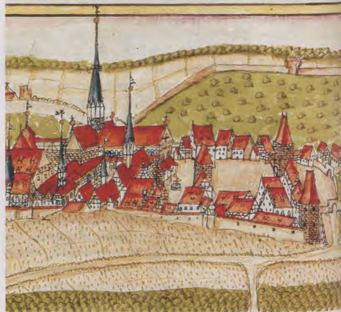
Kloster Maulbronn, Teil des evangelischen Kirchenguts von der Reformation bis 1806. Ansicht von Andreas Kieser, um 1685.