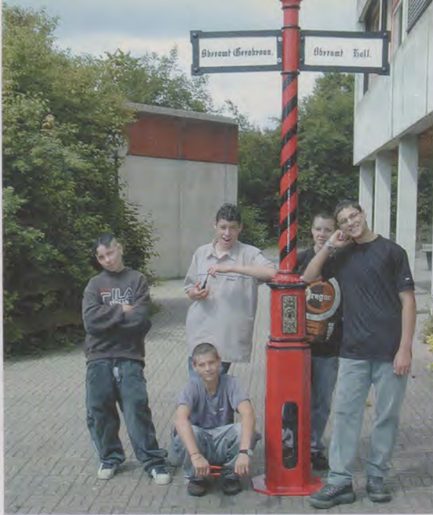
Stolz präsentieren die aktiven Schüler ihren fachmännisch restaurierten «GränzStok».