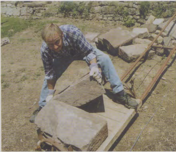
Der Lastenaufzug bewährt sich bestens.

Wasserableitung dienende unabdingbare Hintergemäuer. Die neuen Trockenmauern haben eine Breite von 13 Metern und eine durchschnittliche Höhe von 1,3 Metern. Mit dem «umgekehrten Flaschenzugprinzip» – einem des Patentierens werten Verfahren –, bei dem der eigene Geländewagen als Zugmaschine eine wesentliche Rolle spielt, wurde das gesamte Steinmaterial an den Ort der Bestimmung ge-