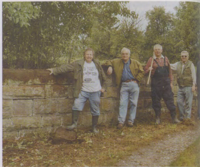
Die Helfer vom Schwäbischen Albverein Öhringen präsentieren sich zufrieden vor der restaurierten Trockenmauer.

Noch etwas zeigt die alte Flurkarte: fünf Keltern, verstreut in der Weinberglandschaft, meist an Weggabelungen. Bis vor wenigen Jahren erinnerte an den alten Kelterplätzen nichts mehr an die Bauwerke, nicht ein einziger Fundamentstein oder Ähnliches. Im Jahr 2000 hat die Ortsgruppe Öhringen des