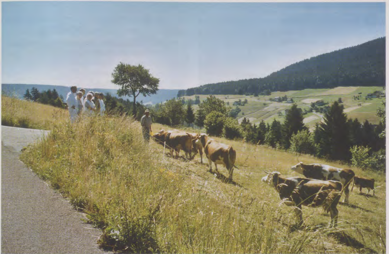
Nur durch dauernde Beweidung sind die vielen Täler im Nordschwarzwald – hier das obere Murgtal – in ihrem althergebrachten Charakter zu erhalten.

tehäuser erfreuen sich großer Beliebtheit und guten Besuchs. Und wiewohl die Fremden den Nordschwarzwald wegen seiner Wälder lieben – allzu viel davon ist auch nicht gut. Die Fichten sollten nicht überall bis an die Häuser reichen, man will doch auch einen Wiesenspaziergang machen und irgendwo auf einer Bank am erhöhten Waldesrand sitzen und über das Tal und die Orte schauen können.