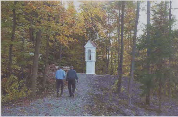
Die «Gute Beth» zwischen Baindt und Bad Waldsee erstrahlt wieder in neuem Glanz.

ming gefragt. Natürlich müssen das Vermessungsamt und die Gemeinde das Ihrige dazutun, aber aufgrund seiner Erfahrung kann der Tuttlinger Kleindenkmalfreund doch manchen Tipp geben, wie man so etwas angeht. Und wie gesagt, sein Aktionsradius ist groß.