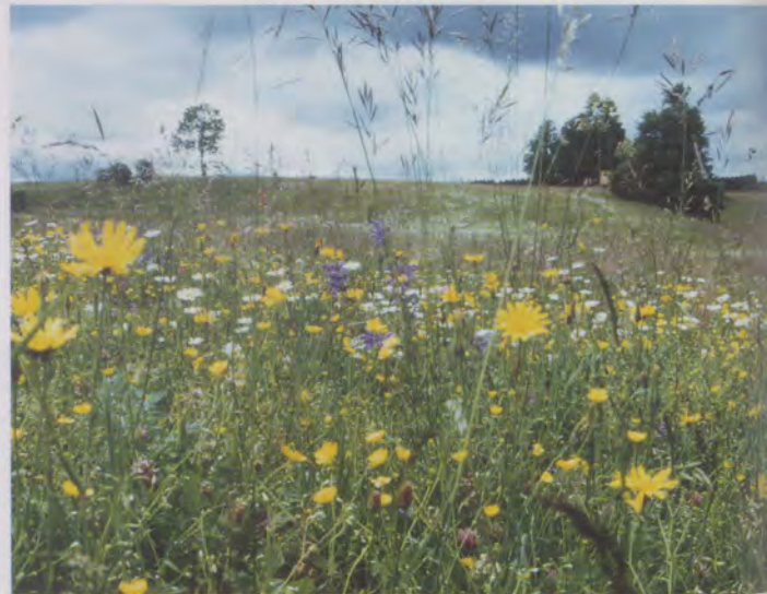
Bunte Blumenwiesen auf dem Heuberg – ein Bild mit zunehmendem Seltenheitswert und nur durch regelmäßige Wiesenmäh auf Dauer sicherzustellen.

Die blumenbunten Wiesen auf dem Heuberg auf der Südwestalb, zum Beispiel im bekannten und durch einen Wanderweg erschlossenen Naturschutzgebiet «Irrdorfer Hardt», sind nicht nur in Kreisen von Naturkundlern bekannt. Viele Wanderer und Ausflügler genießen die herrliche Landschaft. Doch die Bauern, die diese Wiesen auf dem Heuberg bewirtschaften, können nicht von der Schönheit der Wiesenblumen allein leben. In sieben Gemeinden, Obernheim und Nusplingen (Landkreis Balingen), Bärenthal, Irrdorf und Buchheim (Landkreis Tuttlingen) sowie Schwenningen und Beuron (Landkreis Sigmaringen) läuft deshalb das Projekt «Heuberg-AromaHeu», eine «Heu-Börse», die den Landwirten die Abnahme nicht selbst verwertbaren Heus organisiert.