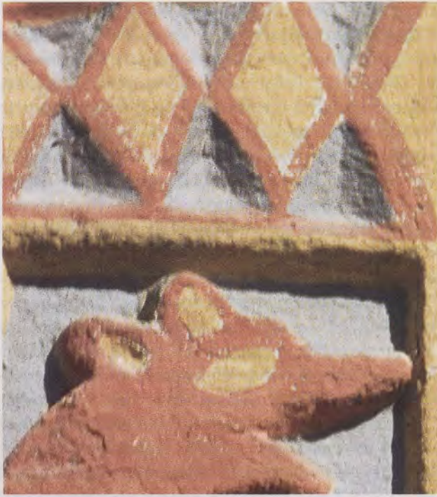
Über dem Kopf des linken Wolfes kann man – von einer waagrechteten Linie abgetrennt – ein Dreieck, zwei Rauten und zwei weitere Linien erkennen, die sich gegen die Säulen der Kosmoskathedrale lehnen.

des Handbuch der mathematischen und technischen Chronologie von F. K. Ginzel, Leipzig 1914, einsehen.