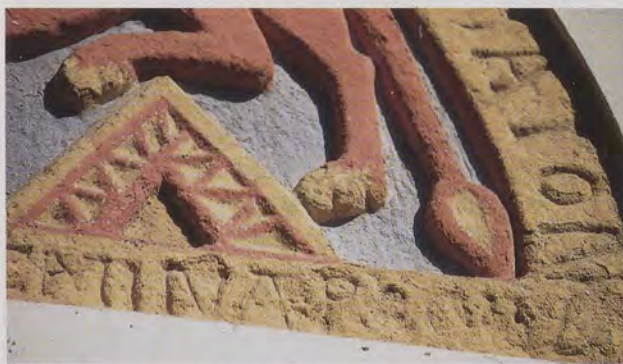
Innerhalb des gleichschenkligen Dreiecks, über das ein Wolf schreitet, erkennt man 12 sprossenartige, nicht parallele Verbindungslinien, die den Mondstand 12 des 1. Mai 1132 angeben.

Auf dem Bietenhausener Tympanon sieht man ein von einem nur teilweise erhaltenen Inschriftenband umgebenes Kreissegment, das durch ein schlankes Säulenpaar in zwei gleich große Teile unterteilt ist. In jedem Teil befindet sich im Flachrelief über der Darstellung eines wolfsartigen Tieres mit langem Schwanz eine Sechser-Rosette. Die Tiere schreiten nach Heinfried Wischermann über gezackte Erhebungen. Die Restflächen füllen Kreise (Kringel), ein Stern und Rauten. Das Beda'sche Bild der Kosmoskathedrale ist trotz vielerlei Zutaten ohne weiteres erkennbar.