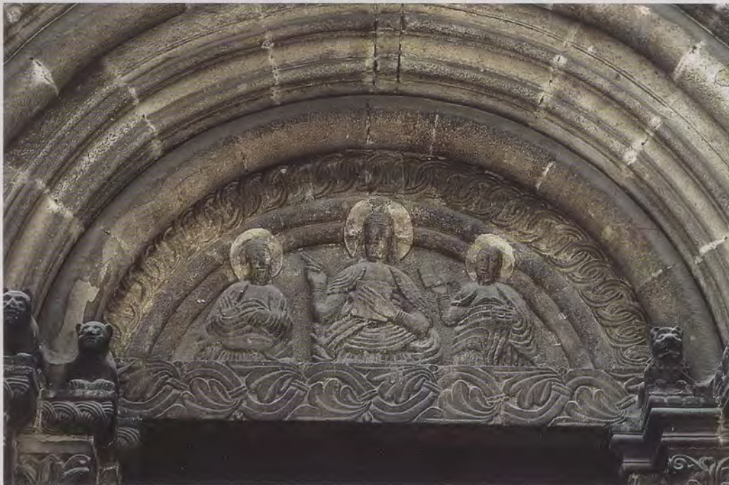
Das Tympanon der aufwendigsten Portalanlage des 12. Jahrhunderts in Deutschland, des Nordportals der Schottenkirche in Regensburg, zeigt Sonntag, den 2. September 1190 an. 29 Kreisringe und 8 Palmblätternbüschel lassen unter anderem auf dieses Datum schließen.

Kunsthistoriker zählen auf Tympana Pflanzenbüschel, Windungen von Schlingpflanzen oder anderen Zierrat nur, wenn sich Anzahlen ergeben wie 4, 7 oder 10, die in der Zahlenallegorese seit Augustin reichste Deutungsmöglichkeiten bieten. Bei 19 oder 17 wird in der Regel geschwiegen. Fragt man nach, kann man durchaus die Antwort erhalten, dass der Steinmetz bei seiner Arbeit wohl einmal 1 zu wenig und einmal 1 zu viel gezählt hat oder dass er sich gar nichts dabei gedacht hat. Aber es kommt vielleicht doch darauf an, dass man 19 Rankenwellen (wie in Pforzheim) zählt und nicht 20, dass man 17 mäanderartige Knoten (wie in Alpirsbach) feststellt und nicht 16. Dann kann sich Neues und Erstaunliches in der so allegorischen Bilderwelt der Romanik auf-tun.