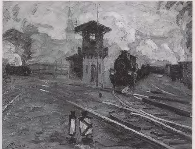
Der Mann, der die Eisenbahn malte

Do.-Sa. 14-17 Uhr, So. und Feiertage 13-17 Uhr Führungen und Gruppen nach Voranmeldung auch außerhalb der Öffnungszeiten. Telefon (0 73 92) 9 68 00-0, Fax 9 68 00-18 Museum zur Geschichte von Christen & Juden Kirchberg 11, 88471 Laupheim