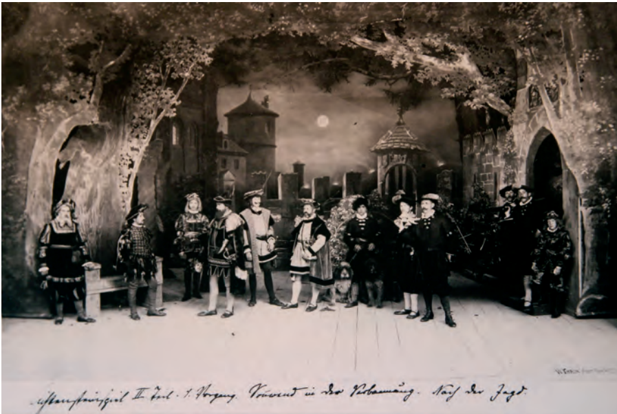
Szenenbild aus dem 2. Teil in einer zeitgenössischen Fotografie

In einer Zeitungsanzeige wurden die letzten Aufführungen im Sommer 1903 beworben.