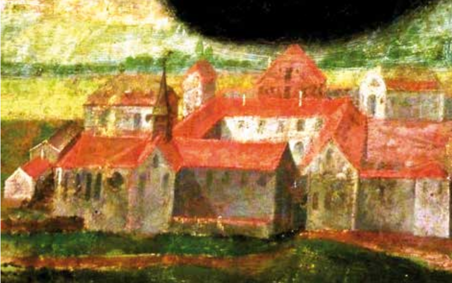
Abb. 3 - Ansicht des Paulinerklosters Langnau, Ausschnitt aus einem ehemaligen Altarbild der Arnoldskapelle in Hiltensweiler, Ölbild 1653, mit dem Anbau der Grabkapelle der Reitnauer zwischen Chor und linkem Querschiff.