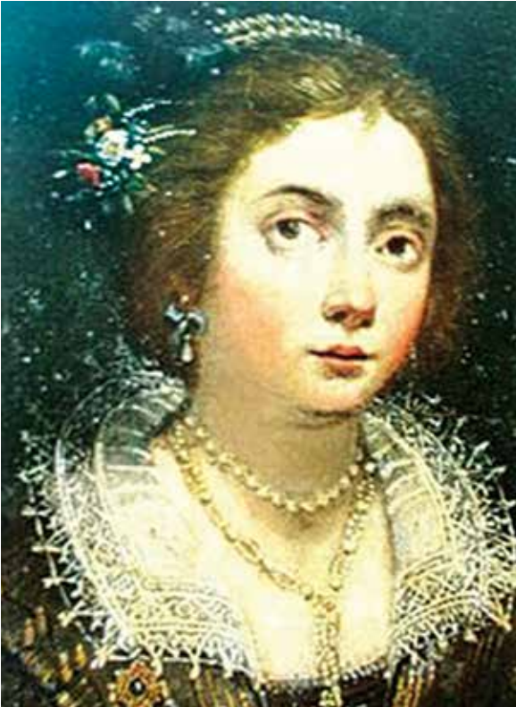
Abb. 5 - Miniaturbildnis der Salome Alt.

Familiensinn bewies Wolf Dietrich auch in seiner Verbindung mit der Salzburger Kaufmannstochter Salome Alt (1568-1633), in ihrer Jugend soll sie das schönste Mädchen von Salzburg gewesen sein. Ungewöhnlich war eine solche Verbindung nicht. In Rom nahm kaum jemand Anstoß an den Geliebten hoher Kirchenfürsten, der Kardinal Hohenems, der Onkel Wolf Dietrichs, begründete mit seinem Sohn die Familie der Duca di Altemps. Auch Wolf Dietrich ließ seine 15 Kinder vom Kaiser vom Makel der unehelichen Geburt befreien und in den Reichsadelsstand von Altenau erheben. Für Salome hatte er das Schloss Altenau (heute Schloss Mirabell) errichten und ihr große Schenkungen im Gesamtwert von mehreren 100.000 Gulden zukommen lassen. Ungewöhnlich war, dass er lebenslang mit ihr verbunden blieb, ein quasi bürgerliches Familienleben führte und kein Geheimnis aus seiner Liebesbeziehung machte. Salome bildete den Ruhepol im hektischen Leben des Erzbischofs und nahm keinen Einfluss auf dessen Geschäfte. Keinerlei böse Stimmen erhoben sich gegen die zurückhaltende und offenbar liebenswürdige Frau.