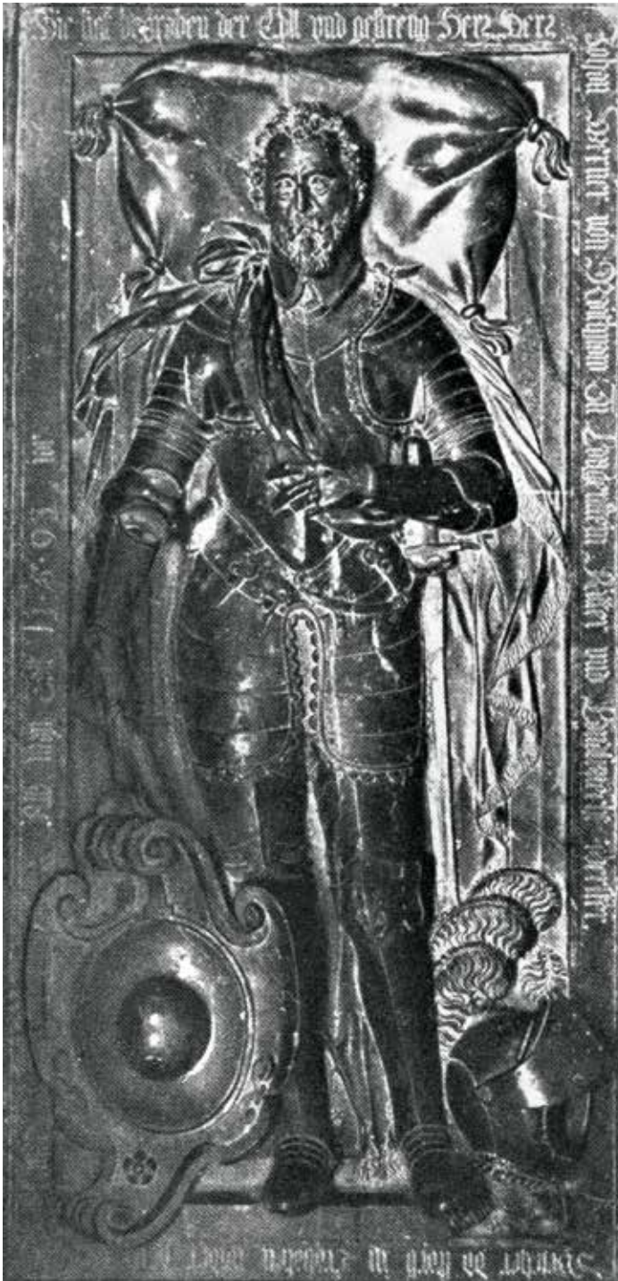
Abb. 2 - Grabmal von Hans Werner III. von Reitnau in der Stiftskirche St. Peter in Salzburg, um 1600.