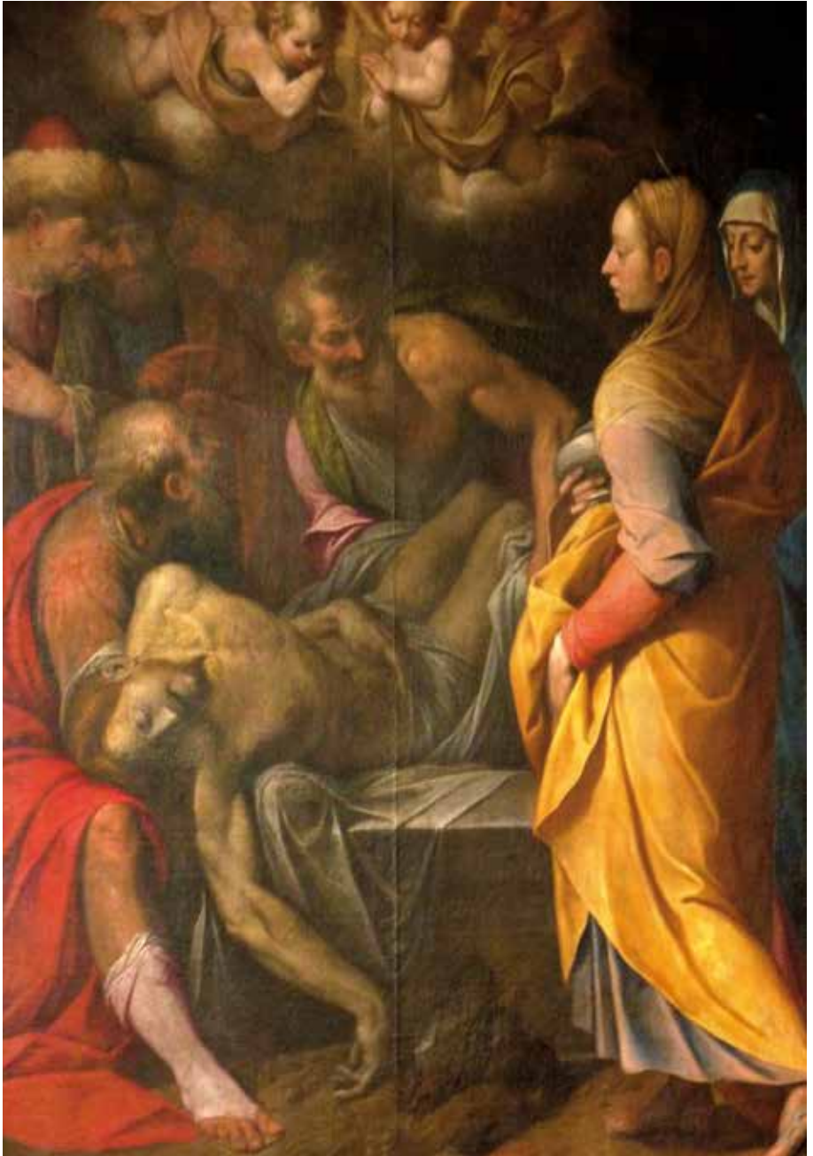
Abb. 1 - Camillo Procaccini: Grablegung Christi, Pfarrkirche Tettngang-Hiltensweiler.