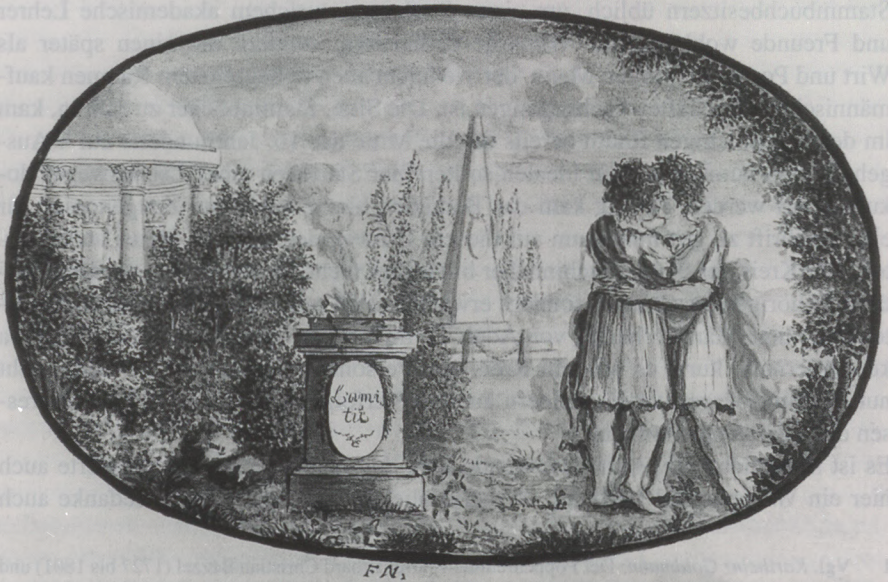
Abb. 1 Darstellung aus dem Stammbuch des Johann Friedrich Lindner, S. 124.

bürgerlichen, nicht-akademischen Kreisen zugänglich wurde. Ausweis dieser veränderten Rahmenbedingungen sind auch die vorliegenden Aufzeichnungen. Neben den sogenannten Freunden tauchen nun als Inskribenten nämlich verstärkt auch Verwandte auf, so daß eine Brücke zu dem, was wir heute unter Poesiealbum verstehen, geschlagen ist. Auch in der Gestaltung der Einträge ist dieser Wandel spürbar. Waren ursprünglich Wappendarstellungen, verbunden mit Devise, guten Wünschen und natürlich der Unterschrift des Eintragers die übliche Form, so kommt nun die Wiedergabe des Familienwappens weitestgehend zum Wegfall, was sicherlich auch damit zu tun hat, daß ein sozial deutlich anders zusammengesetzter Personenkreis häufig über kein Familienwappen verfügte. Breiten Raum nehmen jetzt die Dedikationsformeln und die meist sehr allgemein gehaltenen „guten Gedanken“ ein, welche zumeist mehrzeilig und zum Teil in Reimform gestaltet sind. Genredarstellungen wurden zu allen Zeiten gern den schriftlichen Ausführungen beigegeben, nur daß sie jetzt häufig von den Inskribenten selbst mehr oder weniger talentvoll angefertigt werden. Im Fall des hier vorliegenden Stammbuches können immerhin 12 Aquarelle, teilweise ganzseitig, und ein Scherenschnitt mit der Profildarstellung eines Mannes festgestellt werden 2 . Daß diese Zeichnungen die biedermeierliche Zeit zu Anfang des 19. Jahrhunderts widerspiegeln, versteht sich dabei von selbst.