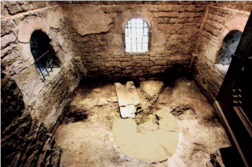
Brunnenkapelle (Bild: Michael Greiner [Red.]: Die Comburgen bei Schwäbisch Hall. Stuttgart 2010)

ben und eine Abflusssrinne führt nach Westen hinaus in den Kreuzgarten. Von Nordosten her erfolgte die Wasserzufuhr ehemals über Leitungsrohre, deren Trasse mit rinnenartig ausgehöhlten Lagersteinen sichtbar wurde. Offensichtlich führte vom Brunnen aus eine abzweigende Leitung nach Nordwesten, hinüber zur Küche bzw. zur Abtei. Die Frage, die sich nun stellte, war: Wie mögen die Rohre dieser Druckleitung vor 900 Jahren ausgesehen haben und aus welchem Material waren diese wie gestaltet? Eine Wasserleitung von mehr als einem Kilometer Länge, die durch das Tal auf den Berg zu führen war, ist für die damalige Zeit ein technisches Meister- und Wunderwerk. Ihre Rohre aus Ton zu fertigen und zu brennen oder sie als hölzerne Deichelleitung zu bauen, war wegen des Druckes, der auf dieser Leitung lag, wohl undenkbar. Völlig utopisch aber schien uns nach unserem damaligen Kenntnisstand eine Leitung aus bronzenen Röhren. So etwas gab es doch seinerzeit noch gar nicht – ganz zu schweigen von den Kosten des Metalls!