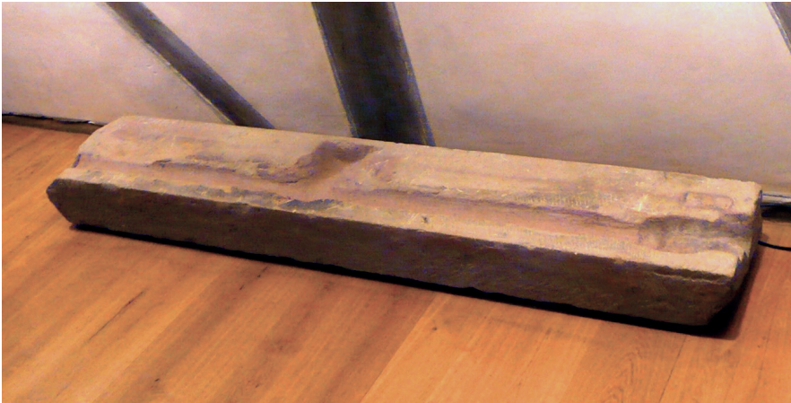
Gussform der Wasserleitung, heute auf der Comburg befindlich