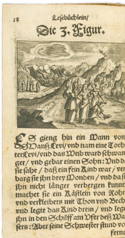
Abb. 3: Kupferstich zu Mose

Die Kupferstiche am Beginn der Abschnitte sind häufig als Sammelbilder gestaltet. Sie deuten mit mehreren Teilszenen simultan in einem Bild an, was in verbaler Form nacheinander erzählt werden muss. So vereint das dritte Bild mehrere Lebensstationen Moses: Rettung als Kleinkind in einem Kästlein auf dem Nil, Durchzug durch das Schilfmeer, Empfang der Gesetzestafeln.