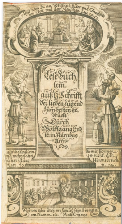
Abb. 2: Titelkupferblatt

Der Anspruch der Bibel auf universale Relevanz ihrer Inhalte sowie die Verortung der Bibellektüre in Schule und Familie nahm dabei Frauen ebenso in die Pflicht wie Männer. Bereits mit dem Elternamt legte es sich nahe, dass Saubert neben den „Schulmeistern“ auch die „Schulmeisterin[en]“ anspricht (Vorrede, S. 9). Dem entspricht die Gestaltung des Titelkupferblattes. Vater wie Mutter halten ihre Kinder Jesus entgegen, der in einem Bildmedaillon als jugendlicher, aber lehrender Jesus dargestellt wird. Ein anderes Bild zeigt den erwachsenen Jesus inmitten seiner Jünger. Mit dem programmatisch vorangestellten Titelkupferblatt verbindet sich folgende Aussage: Christliche Erziehung gründet sich auf die Bibel und ermöglicht dadurch eine Begegnung mit Christus. Das Beispiel des jungen wie reifen Jesus soll dabei veranschaulichen, dass sich Bildung nicht in einem Faktenwissen erschöpft.