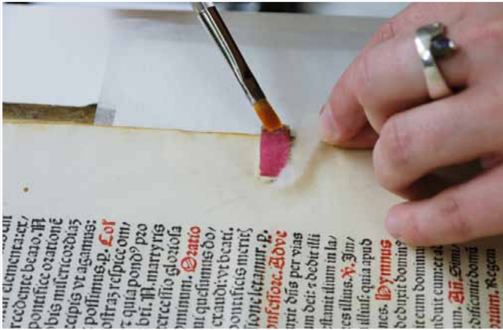
Detailarbeit am Buchblock