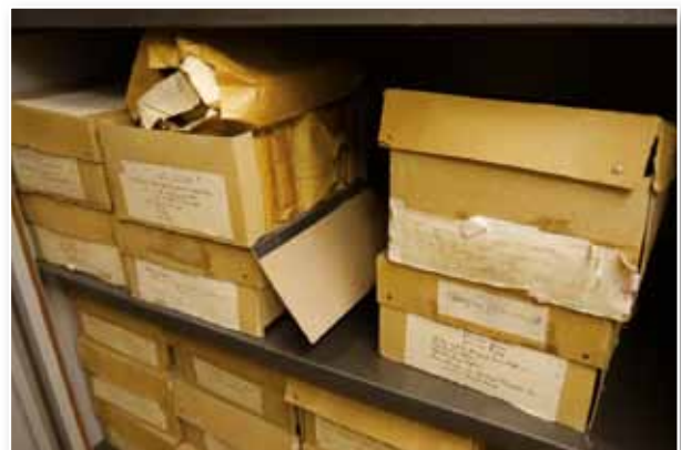
Abb. 1: Nachlass Christoph König vor der Erschließung und Neuverpackung

Ebenso unterschiedlich wie der Zustand des Materials ist der Umfang eines Nachlasses. Manchmal handelt es sich nur um zwei bis drei Archivboxen. In anderen Fällen wird deutlich mehr Platz im Magazin benötigt, um die Materialien unterzubringen. Bei vielen Nachlässen handelt es sich in erster Linie um Briefkorrespondenzen, die in nicht wenigen Fällen durch weiteres Material in Form von Manuskripten, gedruckten Zeitschriftenartikeln oder Büchern ergänzt werden. Häufig sind dies Aufzeichnungen zu eigenen Werken der Nachlasser. Gelegentlich birgt ein Nachlass allerdings auch Notizsammlungen auf Makulaturpapier, die in der Erschließung sehr aufwändig sein können, denn jedes Blatt sollte gezählt und damit foliiert werden. Aber auch ganze Konvolute eigenen