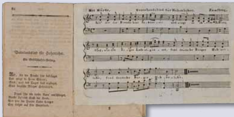
Zuwendung in 2012: Hohenloher Almanach 1803

Die Württembergische Bibliotheksgesellschaft ist die Vereinigung von Förderern der Landesbibliothek, der sowohl Privatpersonen als auch renommierte Firmen angehören. Seit ihrer Gründung 1946 hat sie sich zum Ziel gesetzt, die Württembergische Landesbibliothek ideell und finanziell zu fördern. Die Schwerpunkte liegen darin, die Bibliothek bei der Erfüllung ihrer Aufgaben zu unterstützen, beim Erwerb von besonders hervorragenden Stücken finanzielle Hilfe zu leisten sowie die Öffentlichkeitsarbeit, besonders auch die Ausstellungen, zu fördern. Deshalb sind alle Freunde des alten und neuen Buches eingeladen, durch ihre Mitgliedschaft, den Erhalt und Ausbau der Sammlungen zu unterstützen.