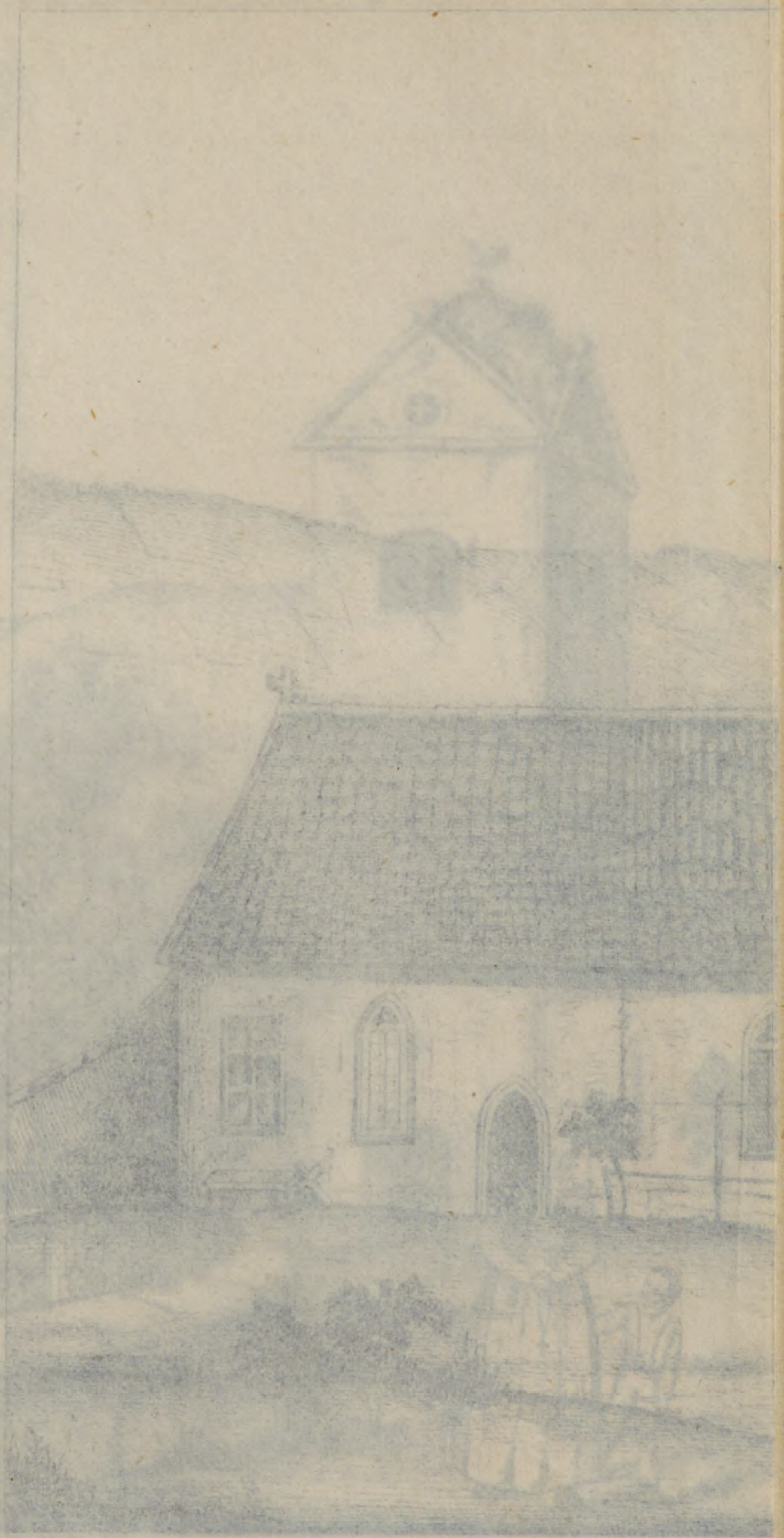
1. Die St. Gangulfkirche bei Verdenburg 190